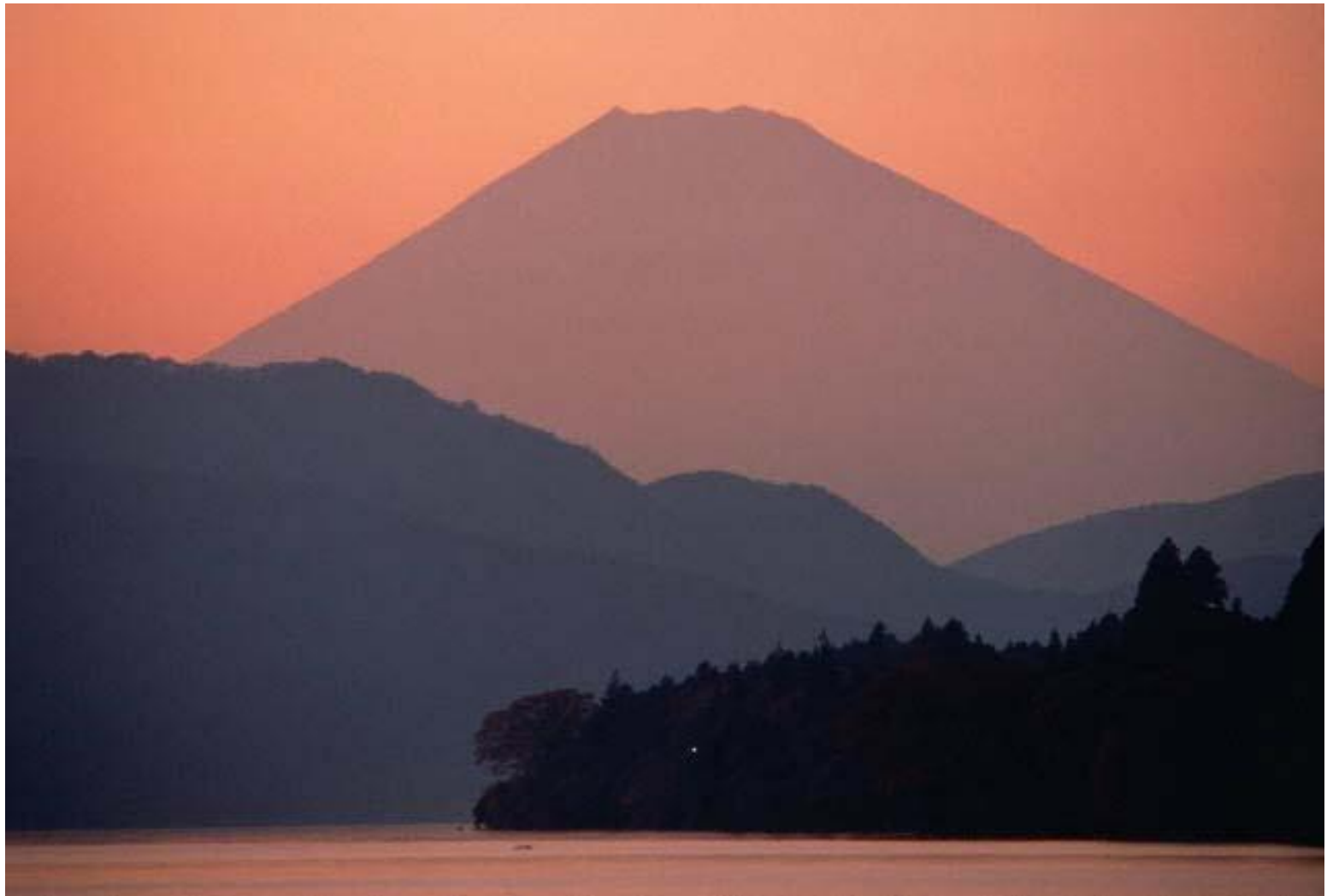
Вулкан Фудзияма в Японии