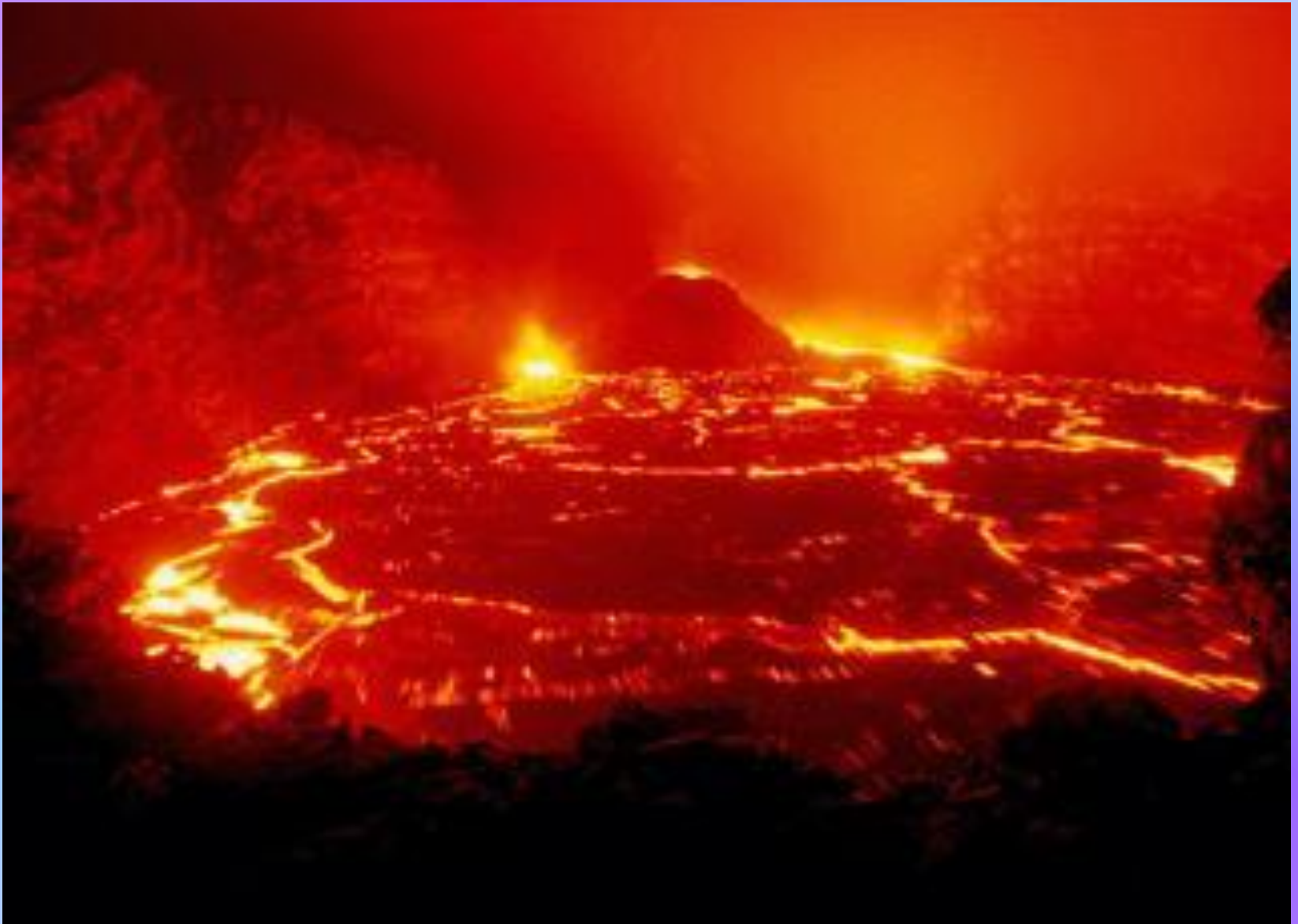
Вулкан Килауза. Извержение лавы