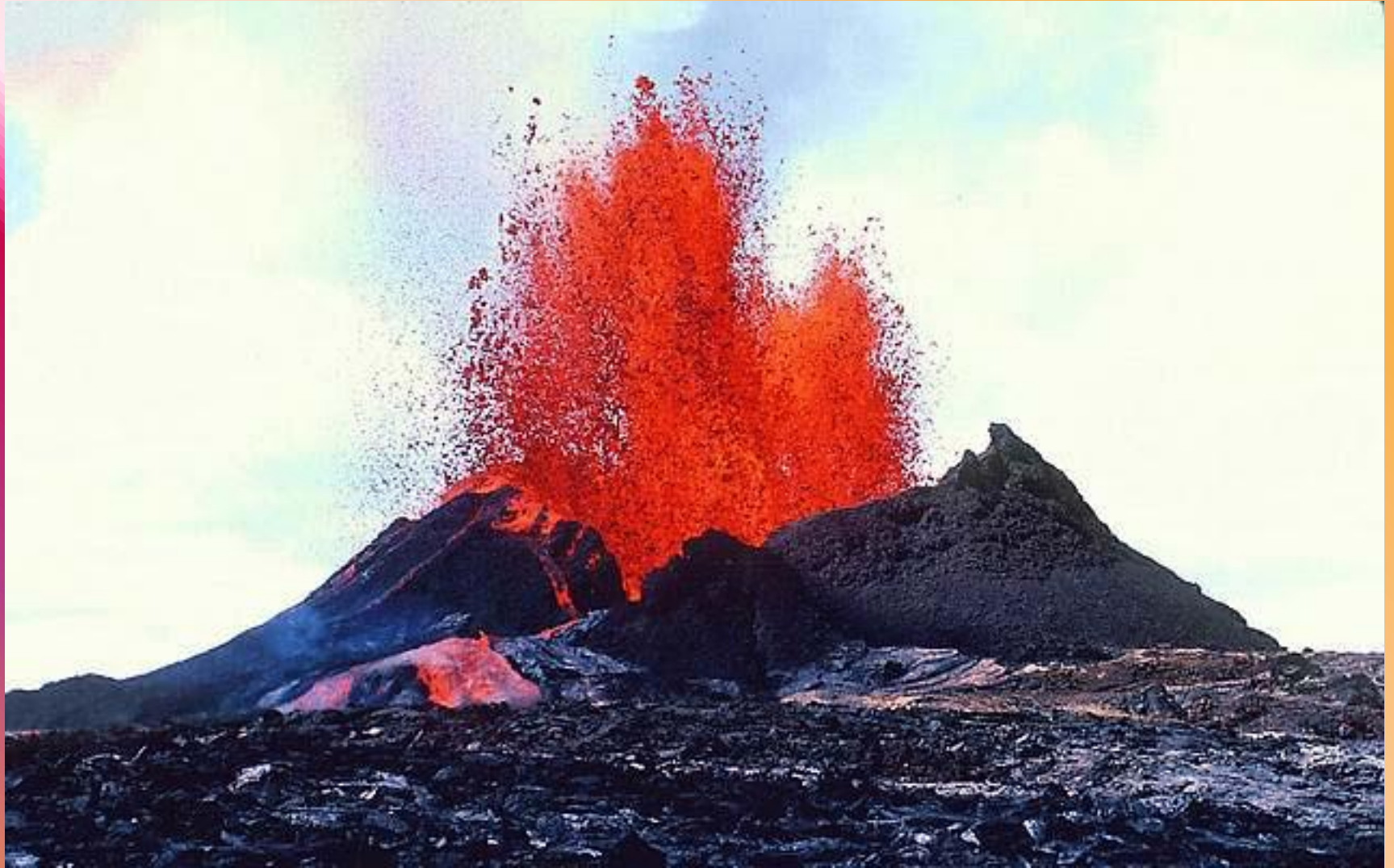
Вулкан Килауза. Гавайские острова