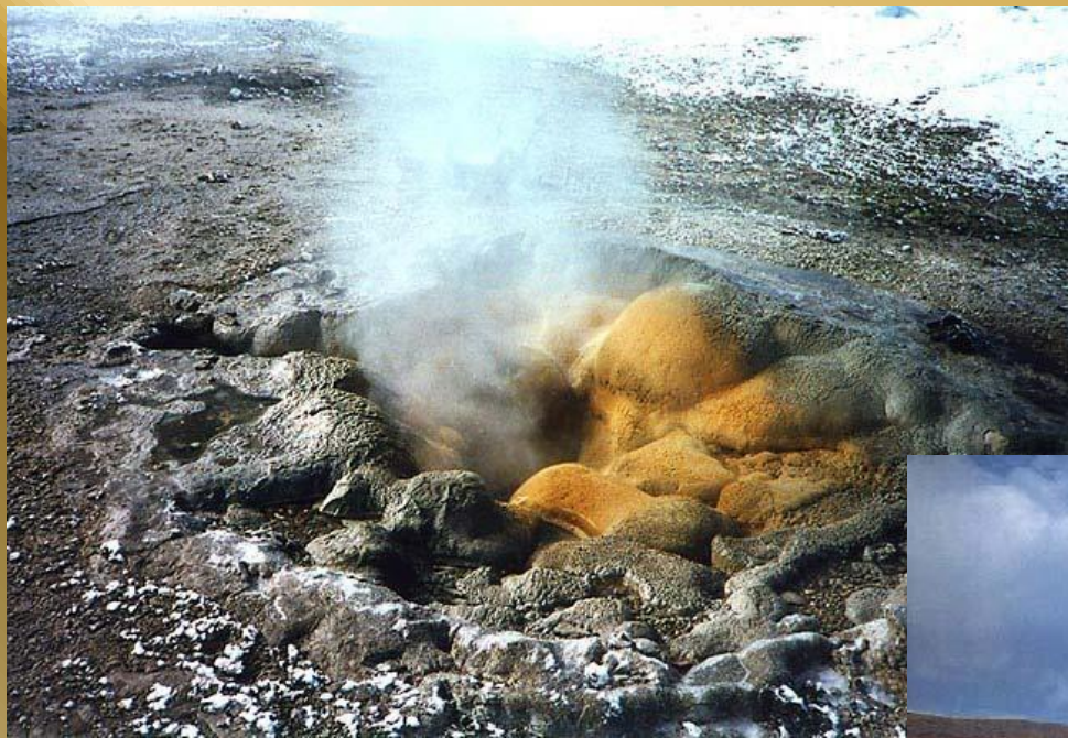
Гейзер «Старый служака»