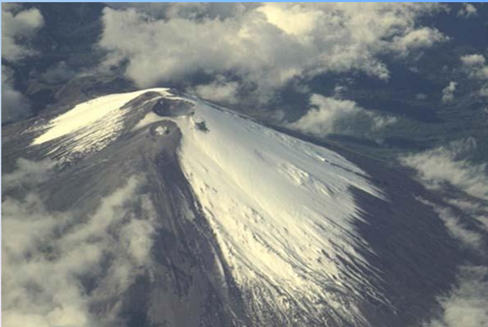
Вулкан в Андах