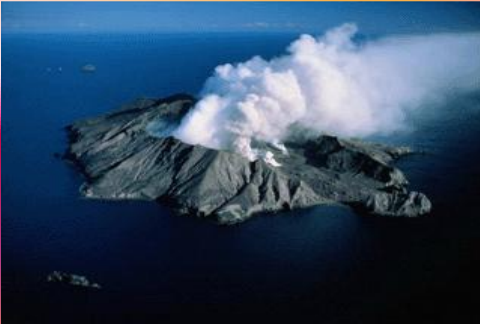
Остров Новая Зеландия