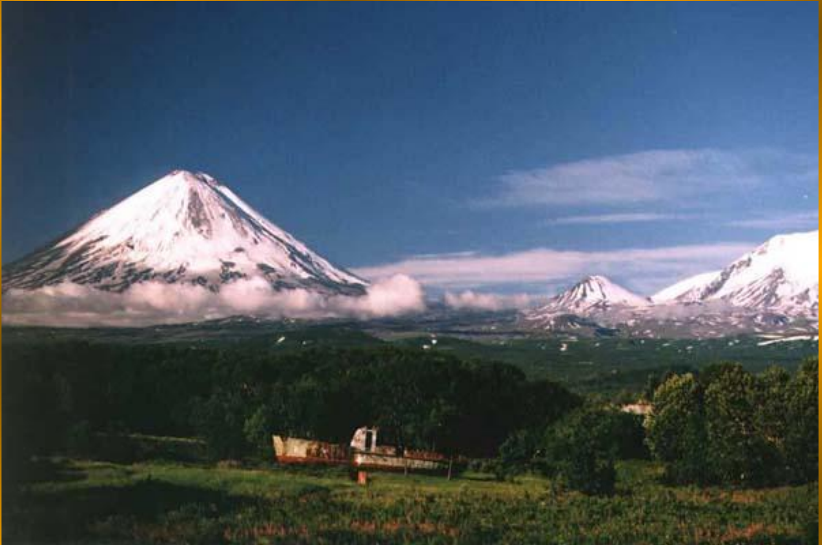
Вулкан Ключевская Сопка