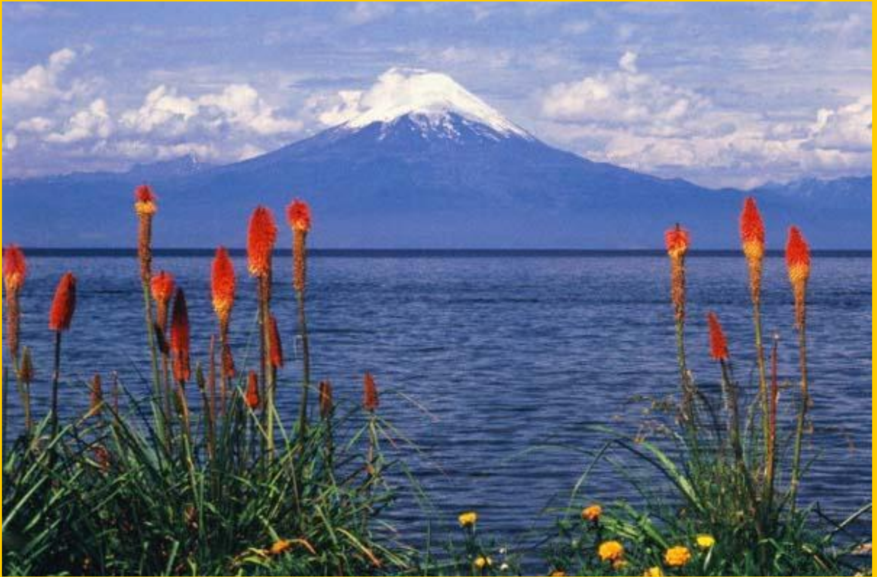
Вулкан Осорно в Чили