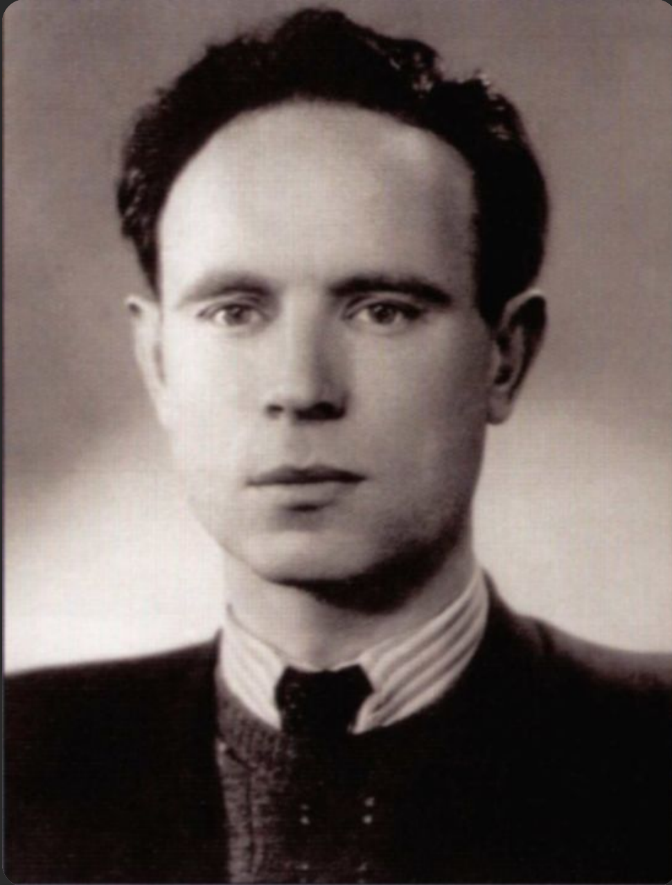
Воробьёв Константин Дмитриевич (1919 — 1975)