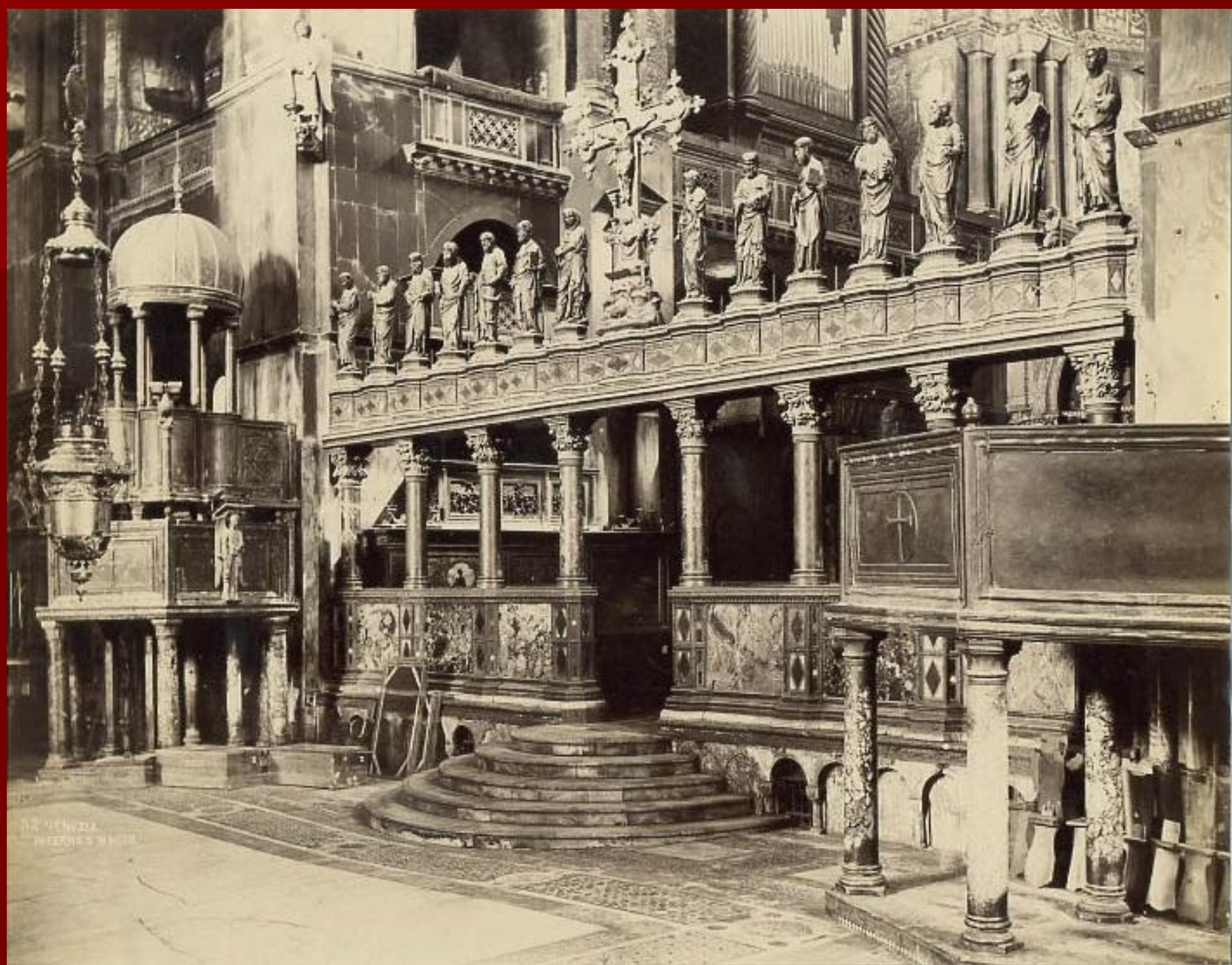
12 VENICE IN FERRETTI'S MUSEUM