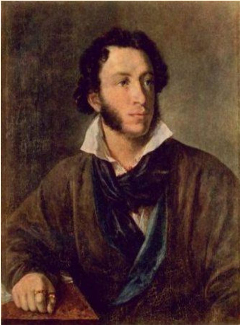
Тропинин В. А.