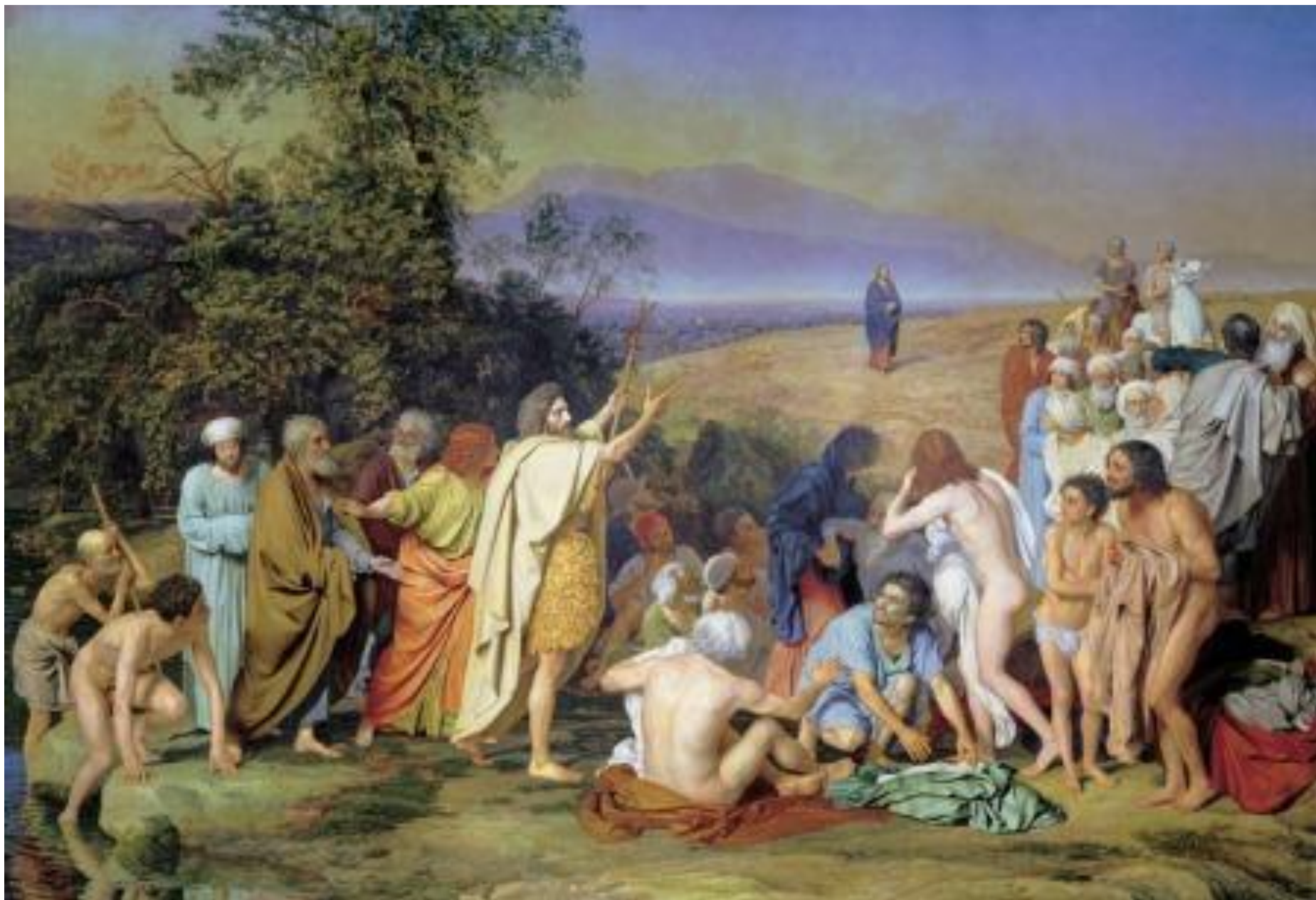
Явление Христа народу. Иванов А. А.