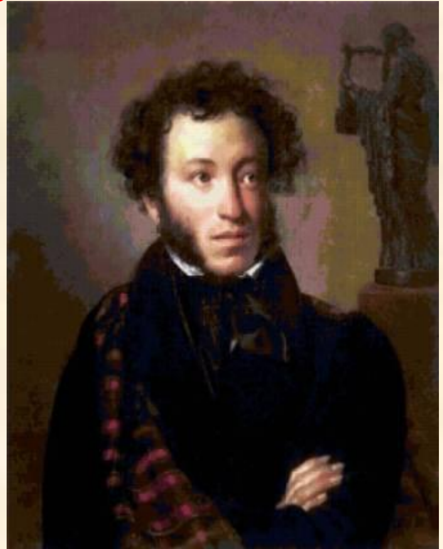
Кипренский О. А.