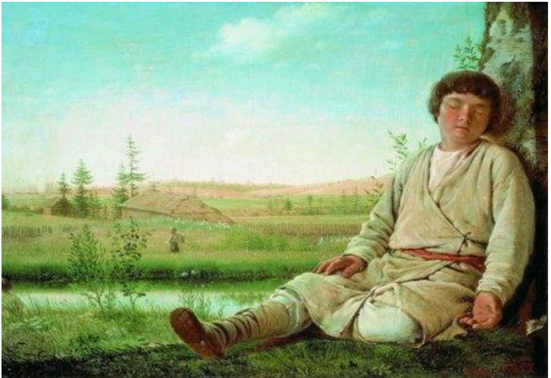
Спящий пастушок. Венецианов А. Г.