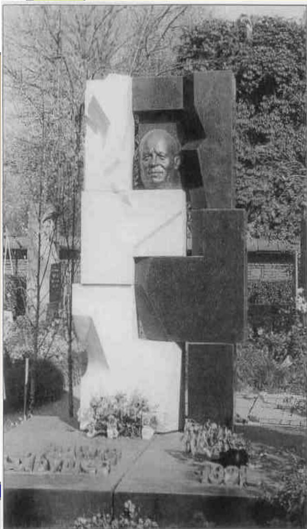
Э. Неизвестный Надгробный памятник

... в этой энциклопедии, безусловно 2 тома: в белой и черной обложках. забота о колхозах - и ликвидация личных хозяйств; реабилитация жертв культа личности - и отказ от реабилитации руководителей оппозиции; возврат в родные места калмыков и ингушей - и отказ в этом немцам и татарам; борьба за мир - и взрыв водородной бомбы на Новой земле; меры по усилению демократизма - и вывод руководителей партийного аппарата из под пресса подлинных выборов; возвращение из лагерей жертв - и защита от суда их палачей.