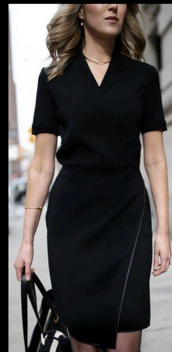
Casual chic повседневный, но из люксовых марок