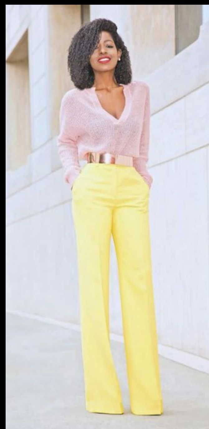
Smart casual с яркими элементами