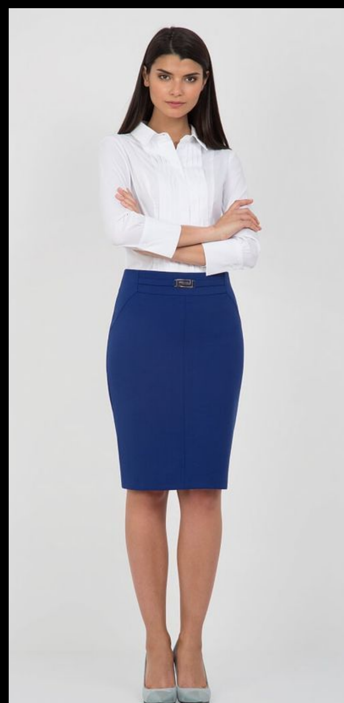
Business casual классика