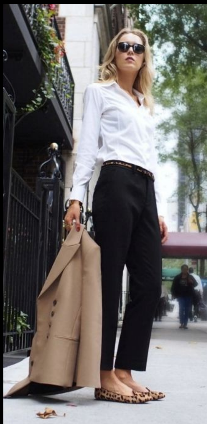
Casual на каждый день