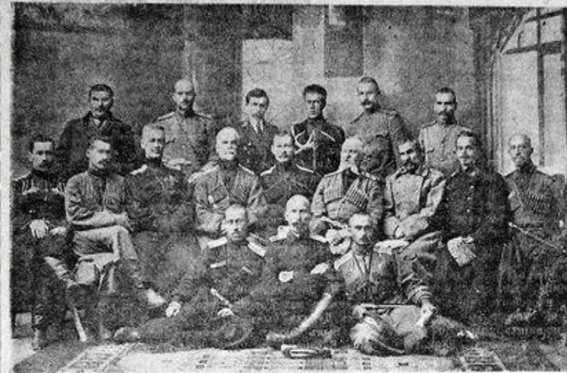
Президиум кубанской законодательной рады.