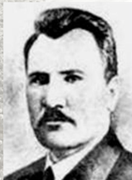
Ян Васильевич Полуян ( 9 октября 1891 - Российская империя - 8 октября 1937, СССР ) - советский государственный деятель, активный участник Октябрьской революции и гражданской войны в России.

Полуян, казак — станицы В конце сентября — первой половине октября заседала Елизаветинской Вторая Рада, принявшая «Временные основные положения о высших органах власти в Кубанском крае».