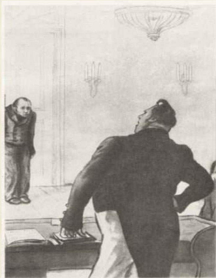
71. Акакий Акакиевич у значительного лица Художники Кукрыниксы, 1952 г., б., черная акварель