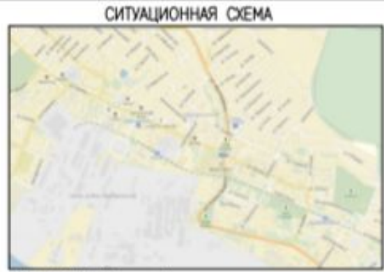
Местоположение реконструируемого объекта