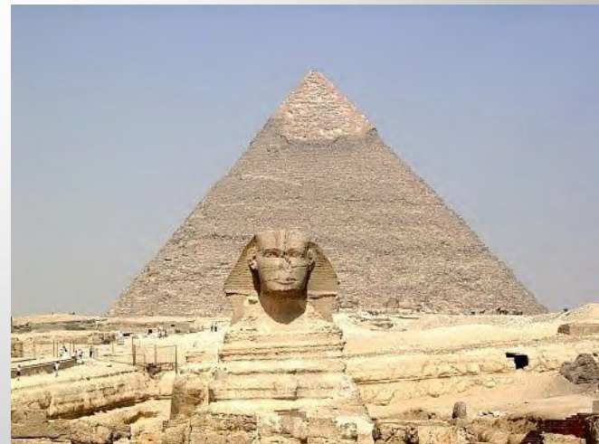
Египет - это древнейшая цивилизация