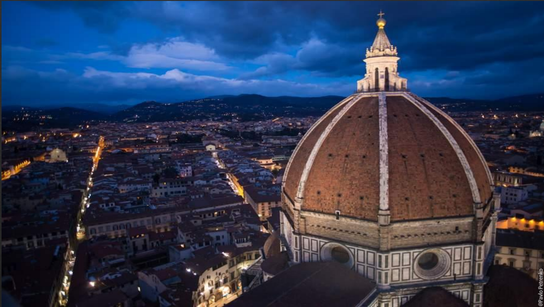
Купол собора Санта Мария дель Фьоре