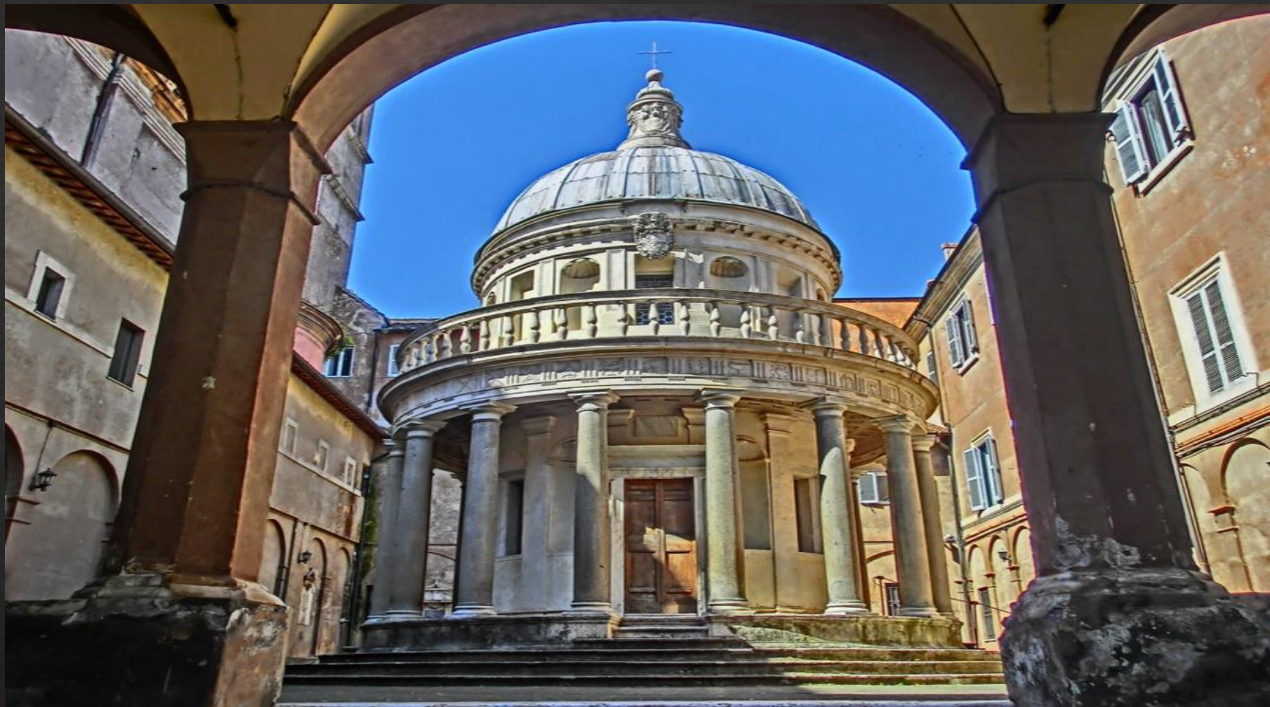
Капелла Темпъетто при църкви Сан-Пьетро ин Монторио (1502)