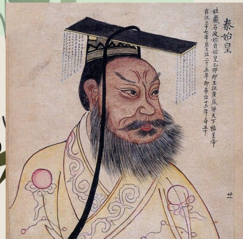
Цинь Шихуанди (Первый китайский император)

Было проведено очень много реформ, но самая запоминающееся из них была "Сто дней реформ". Непродолжительный период реформ, известный как «Сто дней реформ», начался 11 июня 1898 г. с издания императором указа «Об установлении основной линии государственной политики». В общей сложности было издано свыше 60 указов, которые касались системы образования, строительства железных дорог, заводов и фабрик, модернизации сельского хозяйства, развития внутренней и внешней торговли, реорганизации вооружённых сил, чистки государственного аппарата и т.д.