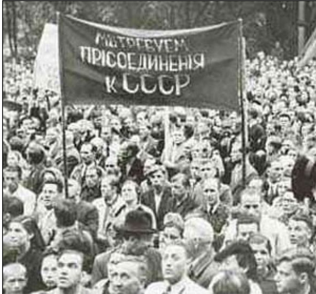
Митинги в Прибалтике с требованием присоединения к СССР.

Возникшие в Эстонии, Латвии и Литве «народные правительства» вскоре обратились к Советскому Союзу с просьбой о вхождении в состав СССР в качестве союзных республик.