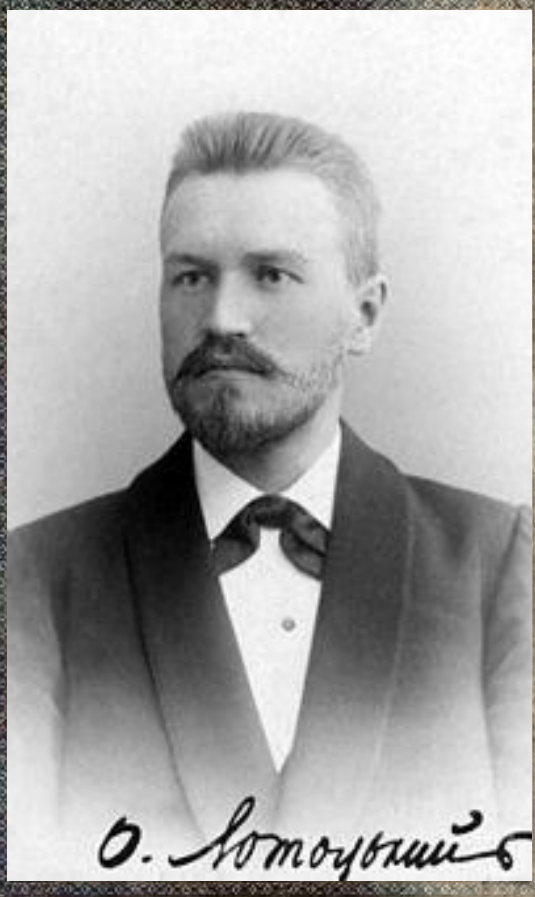
Олександр Лотоцький (1870-1939 рр.)

Очевидець подій про масштаби антиукраїнських заходів «Почалася боротьба з українством і в першу чергу з українською мовою на всьому приступному фронті... Не дозволяли друкувати українські оповістки, співати пісні не лише на концертах, а й просто на вулиці, у селах, українським кобзарям забороняли співати на ярмарках, школярам не вільно було співати колядок, учителі одбирали у школярів Євангелія українською мовою»