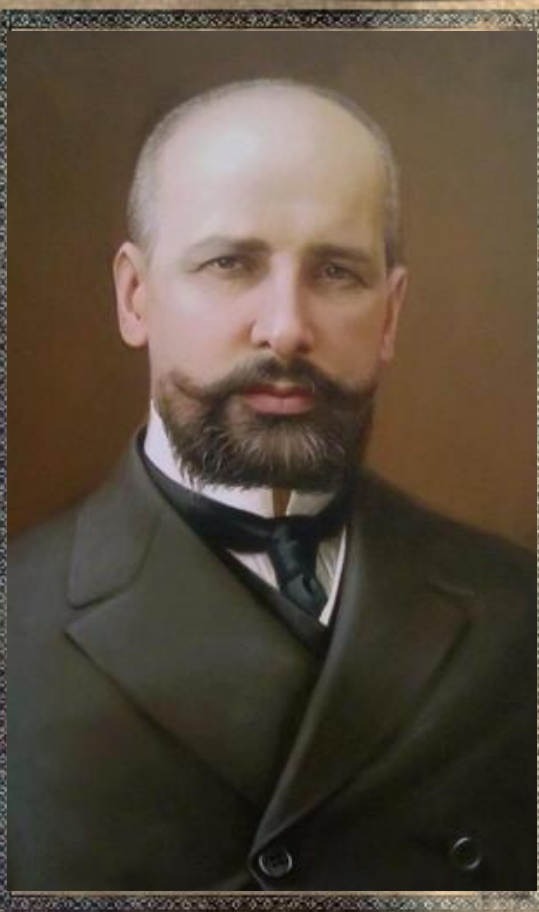
Петро Столипін (1906-1911 рр.)

У квітні 1906 р. призначений міністром внутрішніх справ, а в липні 1906 р. – головою Ради Міністрів. Швидка службова кар'єра Столипіна була, значною мірою, пов'язана з його ораторськими здібностями, численними виступами в Думі, проектами реформування країни.