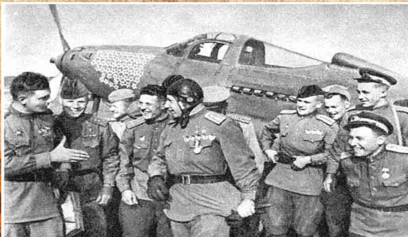
Боевые друзья поздравляют летчика-истребителя А. И. Покрышкина с присвоением ему в третий раз звания Героя Советского Союза.

19 августа 1944 года за образцовое выполнение боевых заданий командования, мужество, отвагу и героизм, проявленные в борьбе с немецко - фашистскими захватчиками, Указом Президиума Верховного Совета СССР Гвардии подполковник Покрышкин Александр Иванович был награждён третьей медалью "Золотая Звезда". Он стал первым в стране трижды Героем Советского Союза.