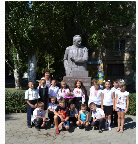
“Моя маленька Батьківщина”