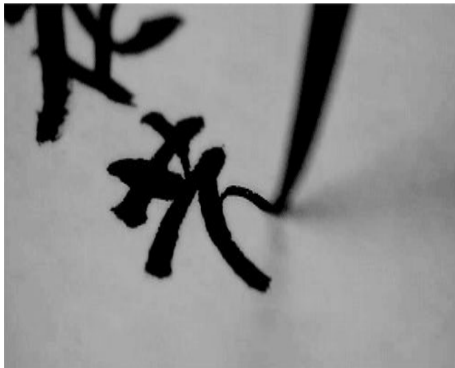
Пример написания японского иероглифа

Традиционное японское искусство невозможно представить без каллиграфии. Согласно традиции, иероглифическая письменность возникла из божества небесных образов. От иероглифов впоследствии произошла живопись. В 15 веке в Японии стихотворение и картина прочно соединились в одном произведении. Японский живописный свиток содержит два вида знаков — письменные (стихотворения, колофены, печати) и живописные, Но и Кабуки — наиболее известные формы театра.