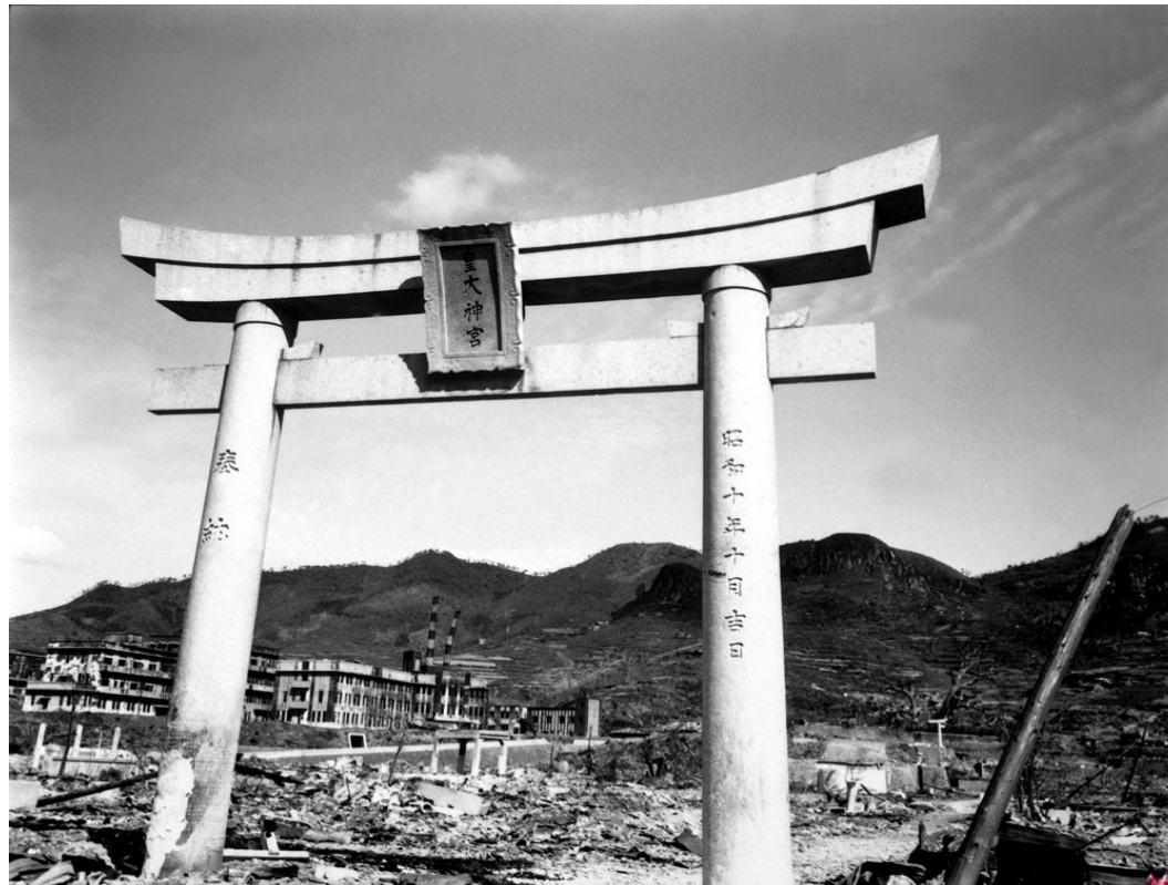
Земля после бомбардировки в Нагасаки, октябрь 1945

Синтоизм- это древняя японская религия, возникшая и развивавшаяся в Японии независимо от Китая. Известно, что истоки синтоизма уходят в глубокую древность и включают в себя тотемизм, анимизм, магию и др. , присущие первобытным народам