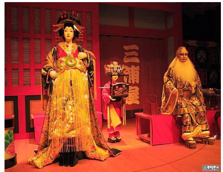
Японский театр Кабуки