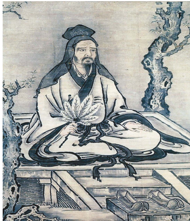
«Конфуций». Кано Таниу, японский живописец.

Расцвет японского конфуцианства начинается в 13 веке. Именно в это время оно приобретает независимость от буддизма, признаётся последователями буддизма.