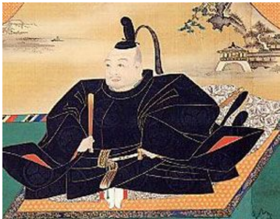
Сёгун Токугава, один из известнейших правителей в истории Японии

Сильное влияние дзэновской модификации видно в литературе (стихи, короткие поэмы), живописи (монохромная, портрет), драме (Но, баллада-драма), архитектуре (храмы, бумажные окна, чайные домики), прикладном искусстве (лакированные шкатулки, ширмы, экраны), в повседневной жизни (искусство аранжировки цветов икебана и марибана, каллиграфия), сохраняется до сих пор. Созданная сегунами эффективная и действенная машина управления почти целиком была использована при создании структуры современного государства во время буржуазных реформ (1867-1912).