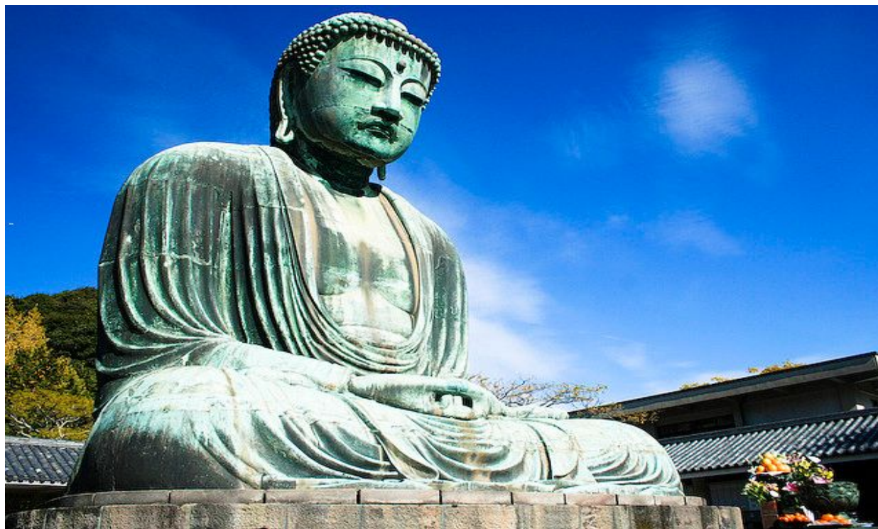
Статуя Будды – „Большой Будда в Камакуре“ в Японии близ г. Токио

Буддизм возник в Японии еще до нашей эры, но получил распространение только в 5-6 веках. не подлежит сомнению, что Хейанский период (8-12 века) является золотым веком японской государственности и культуры, в становлении которых существенную роль сыграл буддизм.