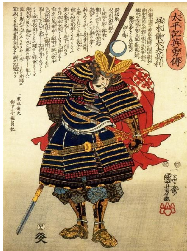
Самурай. Японская гравюра.

После 1185 года господствующие позиции в государстве занимают самураи. Каста самураев, или буси, приносит свой образ жизни, что влечет изменения в духовной жизни. Почетное место занимает дзен-буддизм. Причинами возникновения дзен-буддизма является то, что в условиях междоусобных войн централизованная власть нуждалась в идеологии.