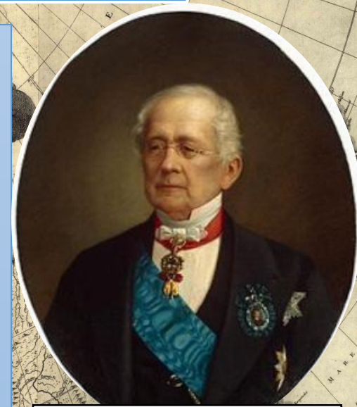
А. М. Горчаков

Своими действиями А.М.Горчаков фактически развалил антирусский союз и вывел Россию из международной изоляции.