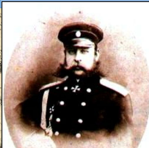
Генерал М.Д. Скобелев.