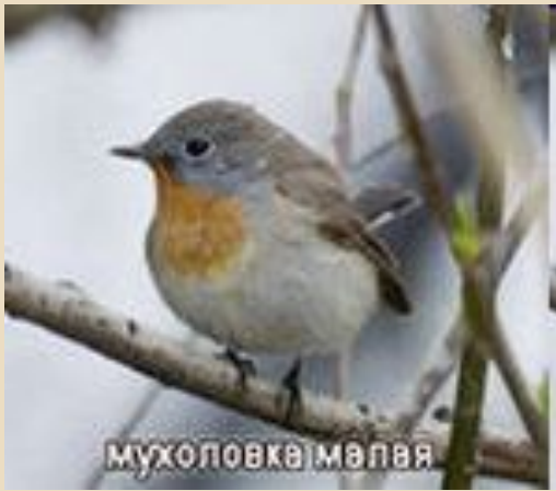
мухоловка і м'яля