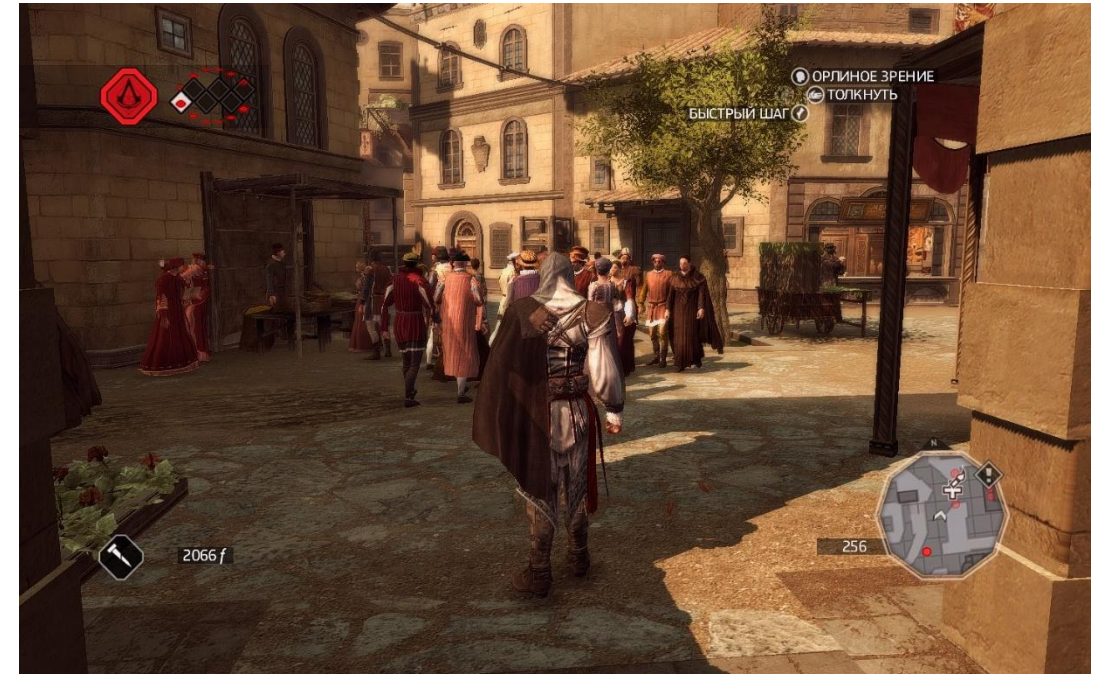
Assassin's Creed II