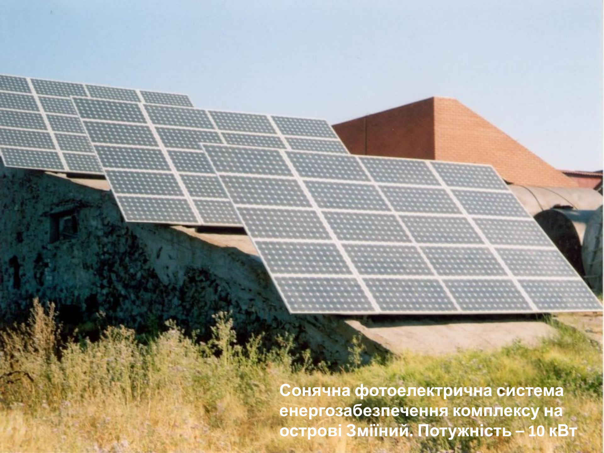
Сонячна фотоелектрична система енергозабезпечення комплексу на острові Зміїний. Потужність – 10 кВт