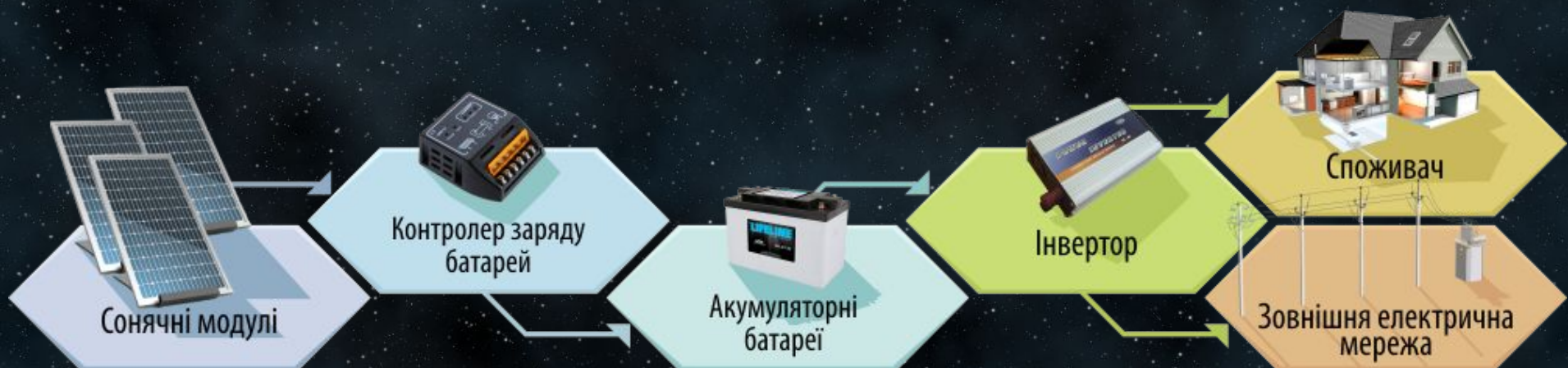
Схема домашньої СЕС