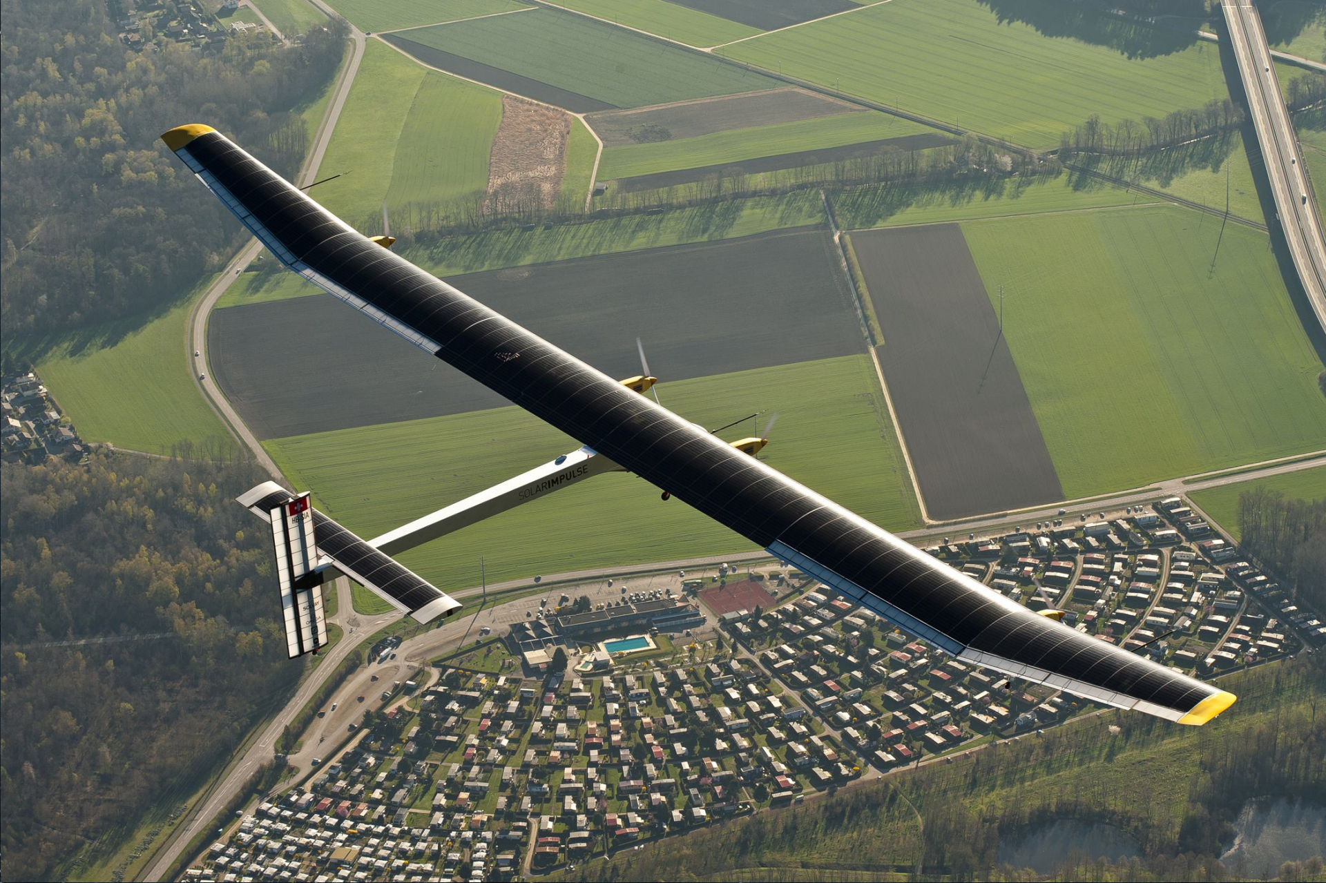
Пілотований літак на сонячних батареях HB-SIA