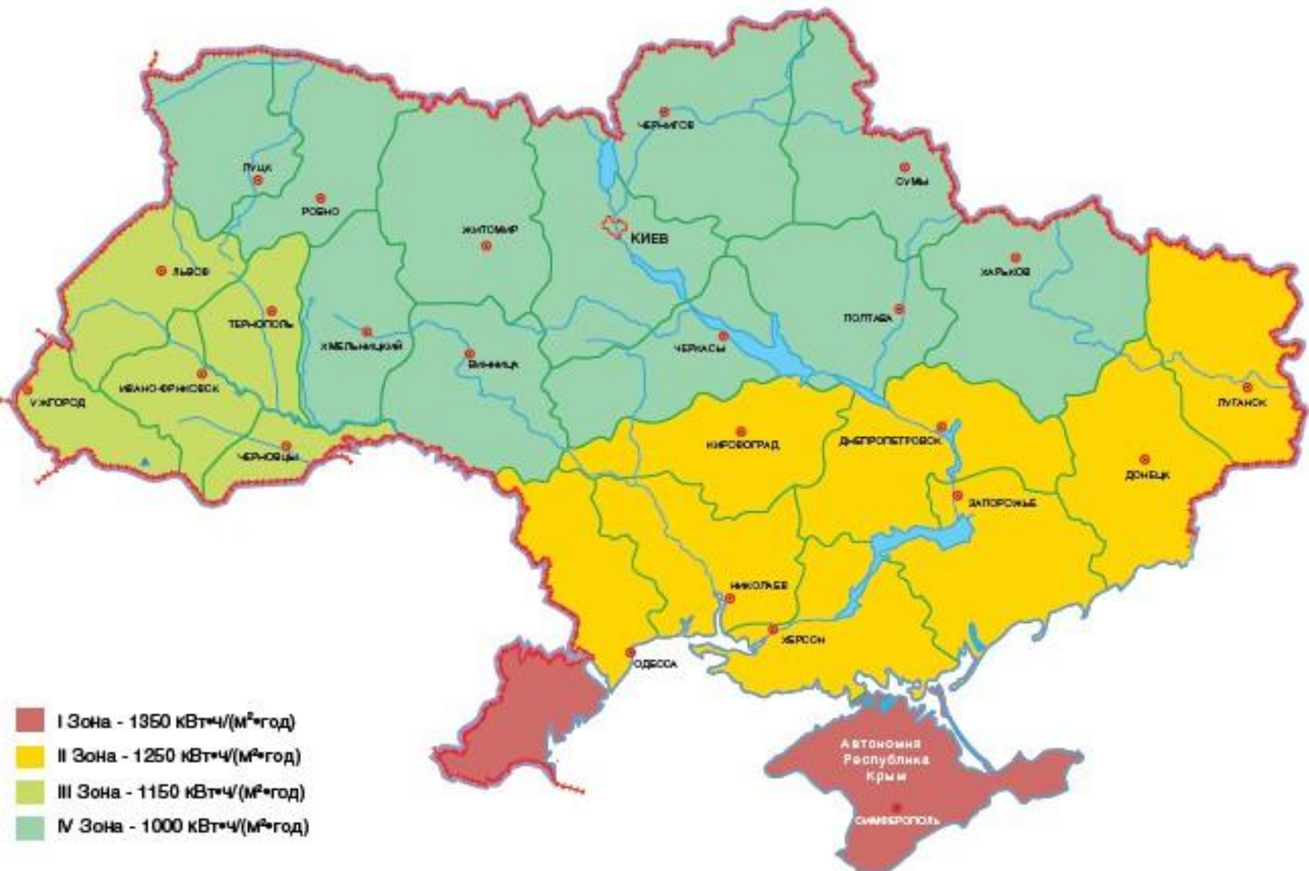
Потенціал сонячної енергії України