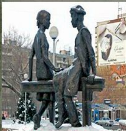
«Несовершеннолетним труженикам тыла 1941-1945гг» г. Самара