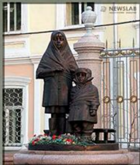
«Детям войны» г. Красноярск