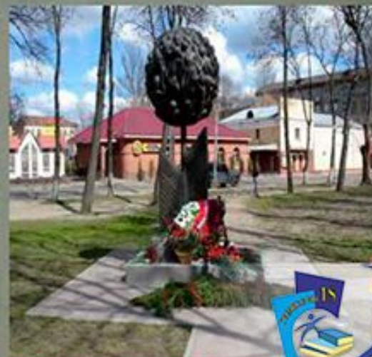
«Дети, узники фашистских концлагерей – Оттаженные цветы» г. Симферополь