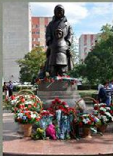
«Детям войны» г. Оренбург