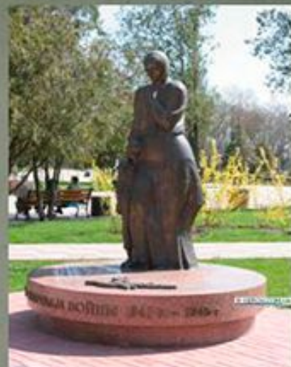
«Дети - жертвы войны» г. Керь