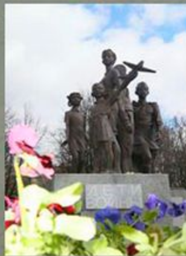
«Детям войны» г. Санкт-Петербург