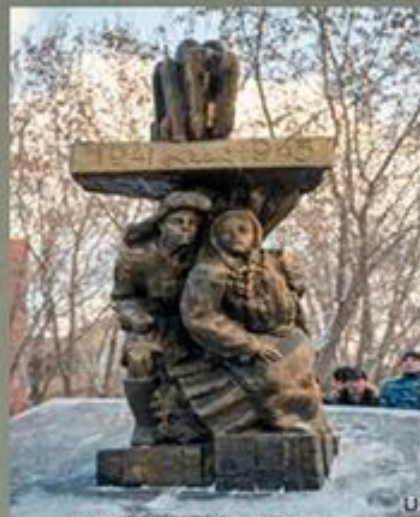
«Детям войны – труженикам тыла» г. Екатеринбург