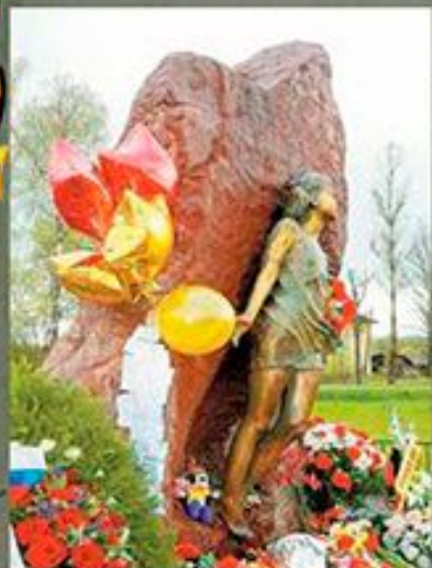
«Детям, погибшим в годы ВОВ» Новгородская обл., п. Лычково