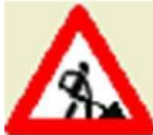
• Дорожные работы