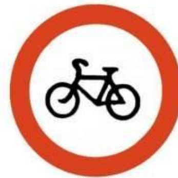
Движение на велосипедах запрещено