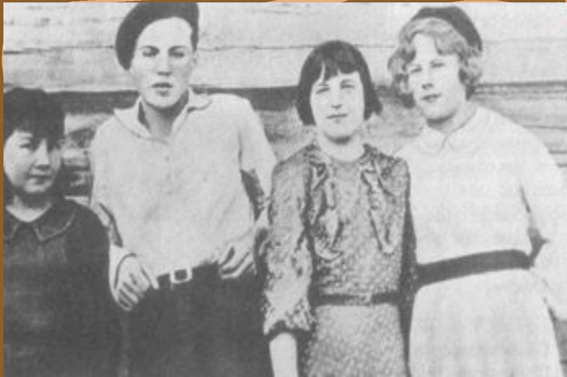
Детский дом. Игарка. 1941 г.

"Самостоятельную жизнь я начал сразу, безо всякой подготовки", - напишет впоследствии В. П. Астафьев.