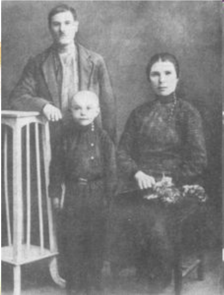
С родителями 1931 год.