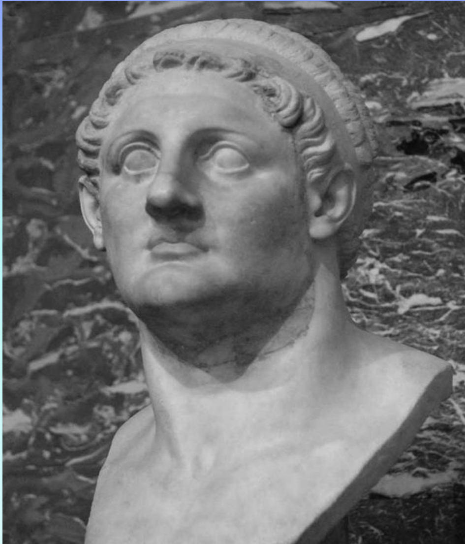
Селевк I Никатор