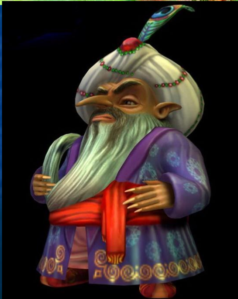
М.И Глинка. Марш Черномора