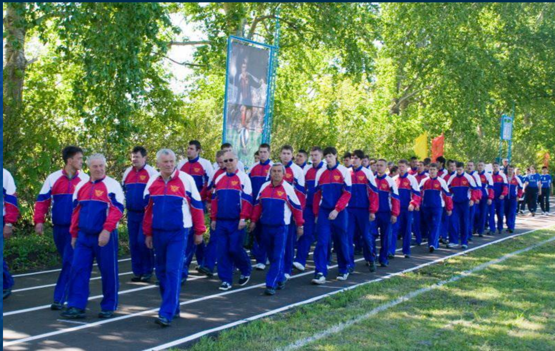
И.О. Дунаевский. Марш физкультурников