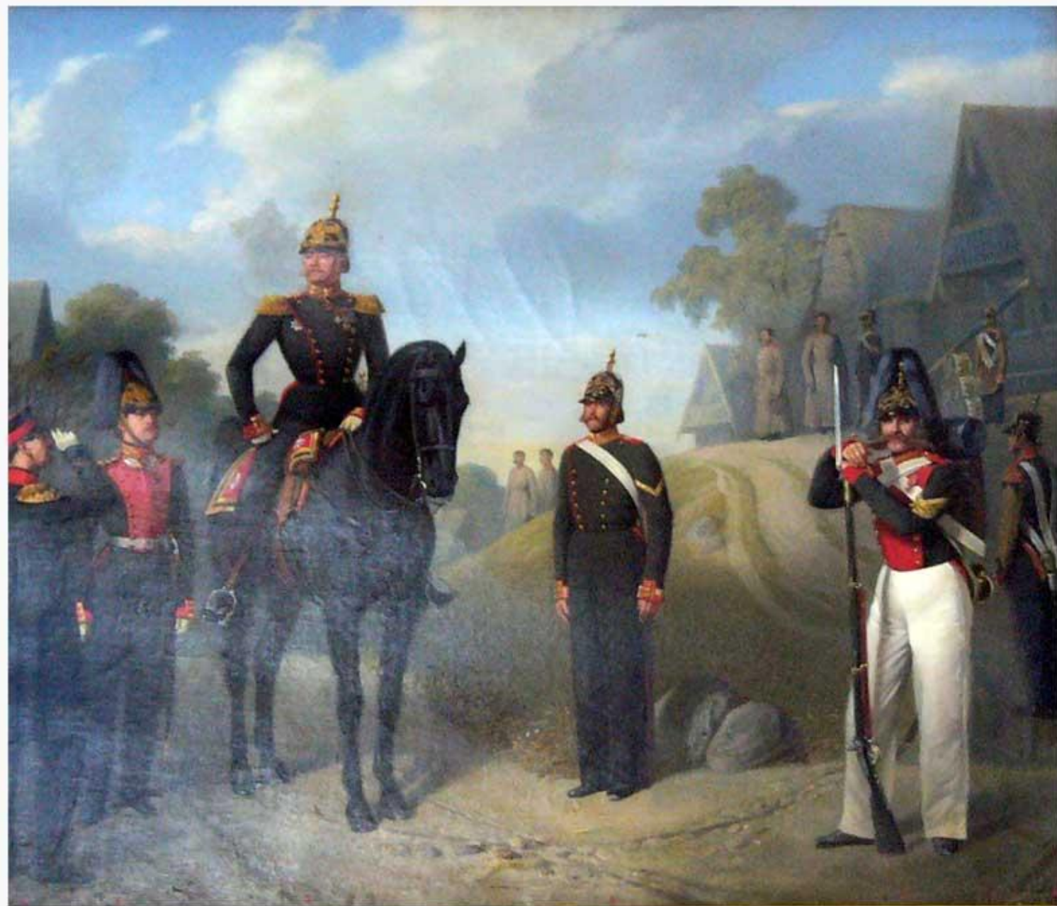
Офицеры и рядовые Лейб-гвардии егерского полка