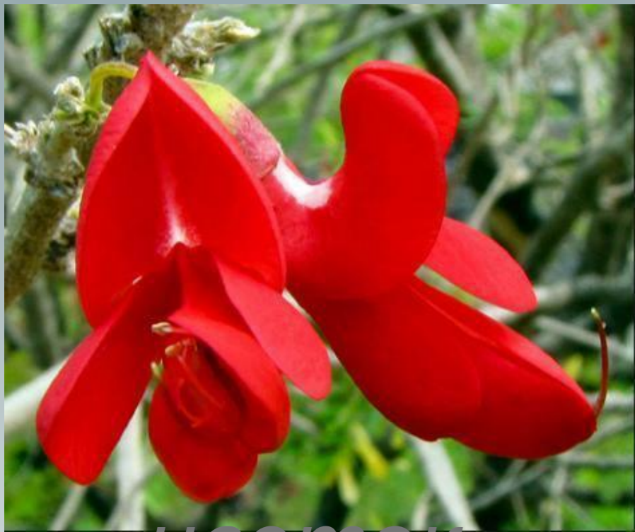
цветок Bwa Kwaib — националь ное растение Доминикан