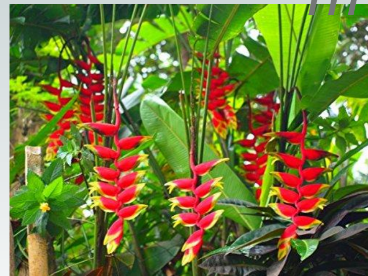
Геликония — благоухаю щее растение Монтсерра т