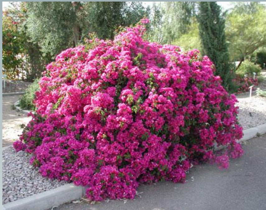
Бугенвиллея - национальное растение Гренады