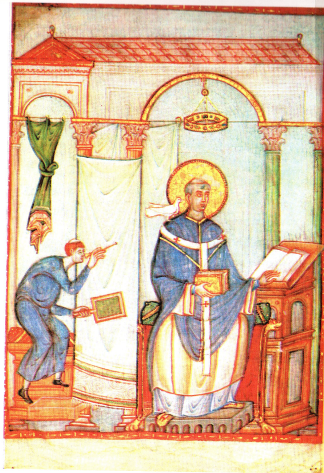
Григорий Великий. Книжная миниатюра. Трир (ок. 983г.)