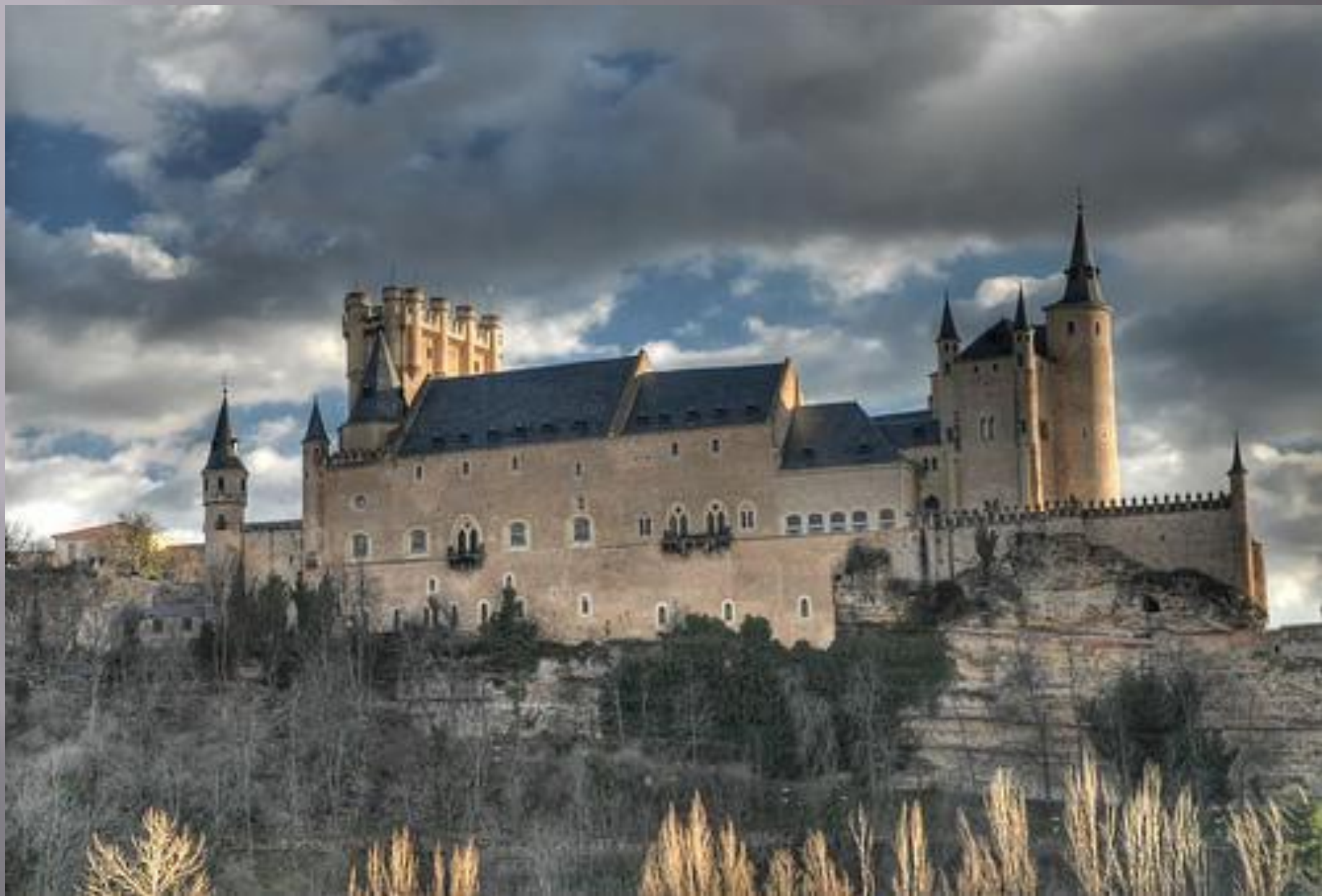
Королевский дворец Алькасар