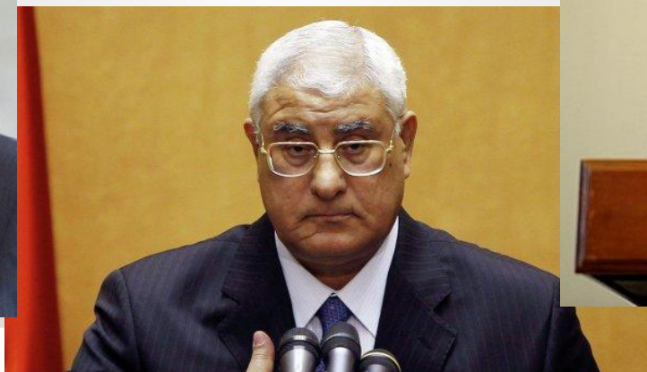
Адли Мансур (2013-2014 гг.)