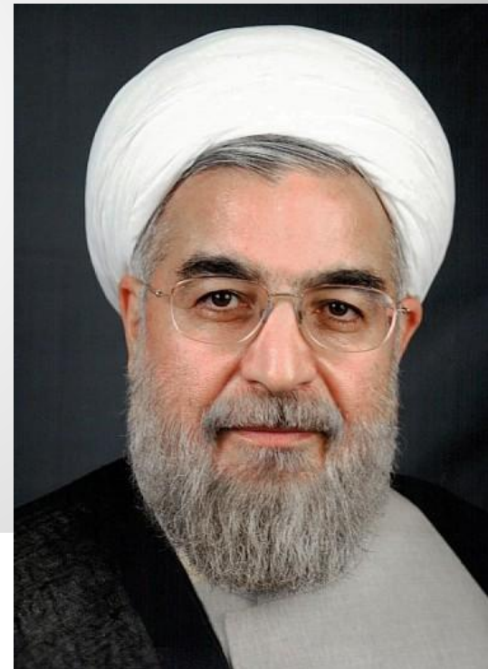
Президент Ирана – Хасан Рухани (с 2013 г.)