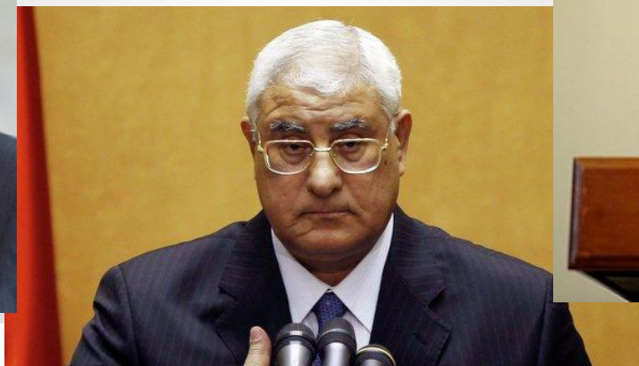
Адли Мансур (2013-2014 гг.)