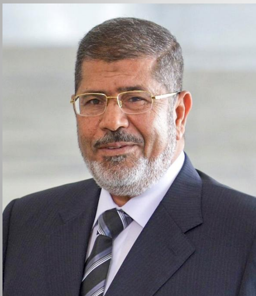
Мухаммед Мурси (2012-2013 гг.)