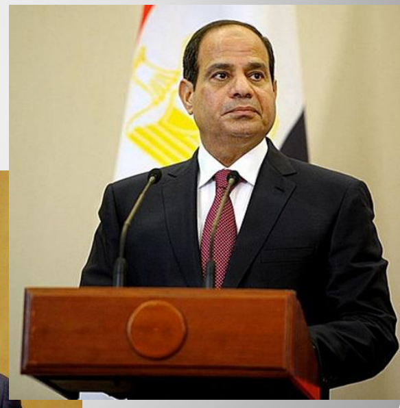
Абдул Фаттах Халили Ас-Сиси (с июня 2014 г.)