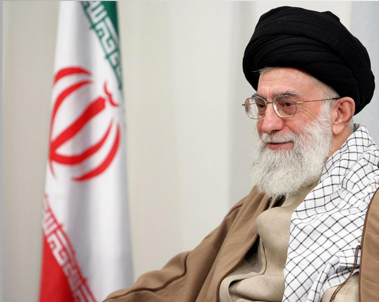
Высший руководитель Ирана – Али Хосейни Хоменеи (с 1989 г.)