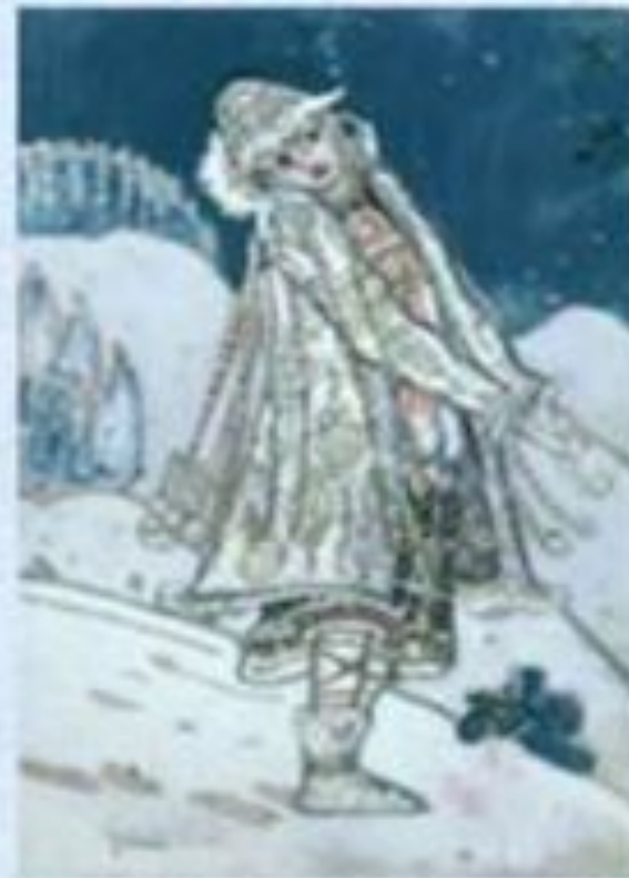
Н. Рерих «Снегурочка»