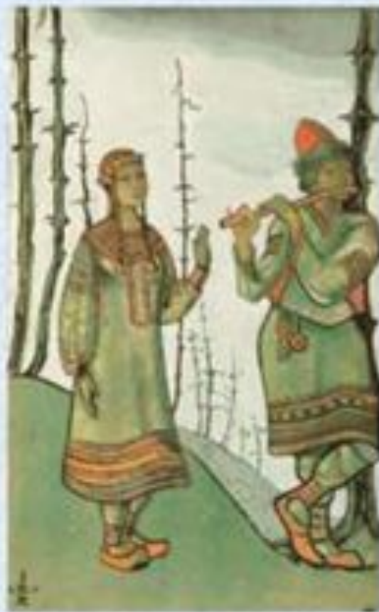
Н. Рерих «Лель и Снегурочка»