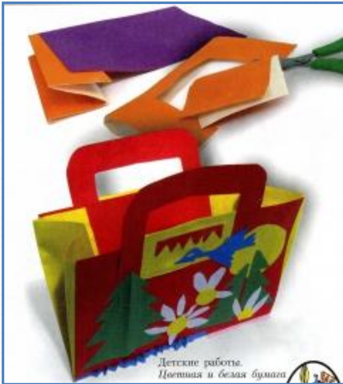
Детские работы. Цветная и белая бумага