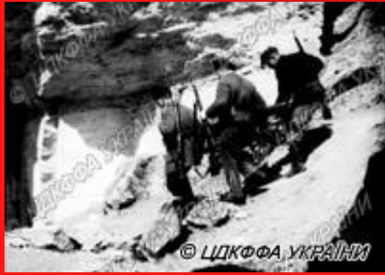
3) Пересування аджимушкайських партизанів у гірській місцевості Криму. 1942 р. од. обл. 0-124986