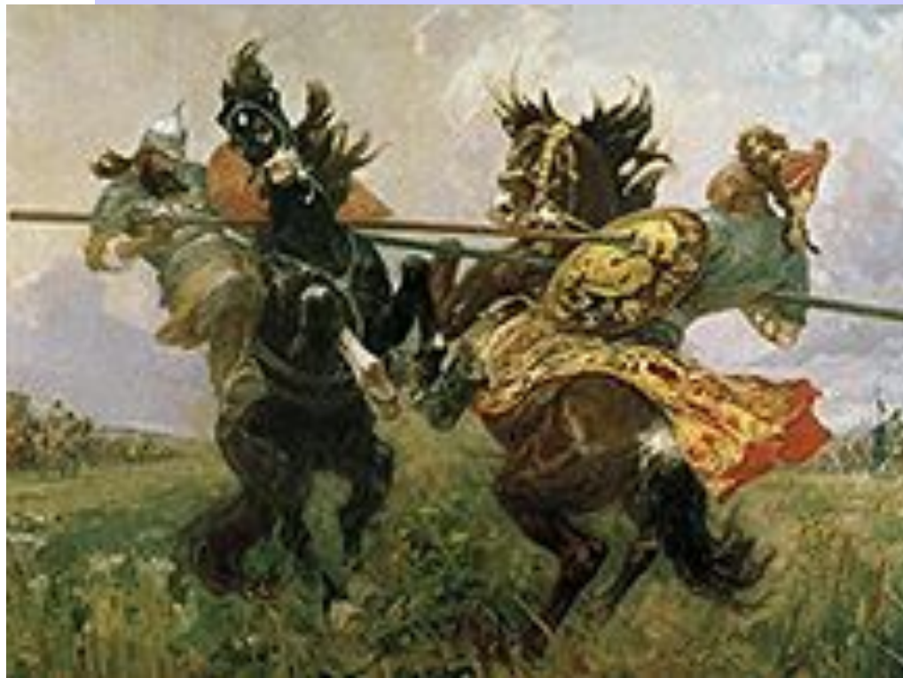
М.И. Авилов Поединок на Куликовом поле