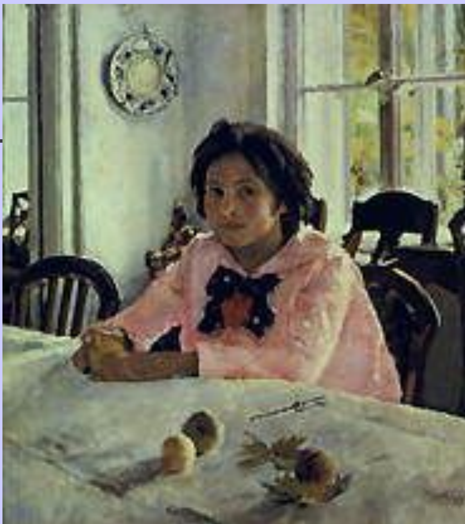
В. А. Серов. «Девочка с персиками».