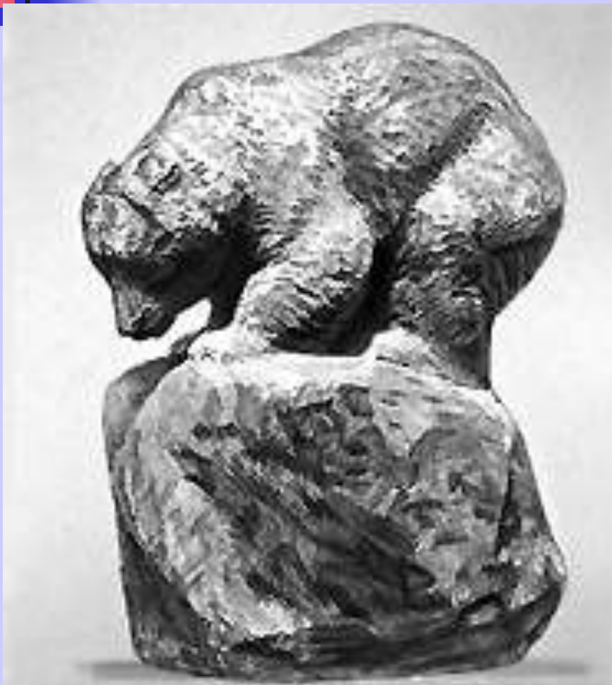
В. А. Ватагин. «Медведь».