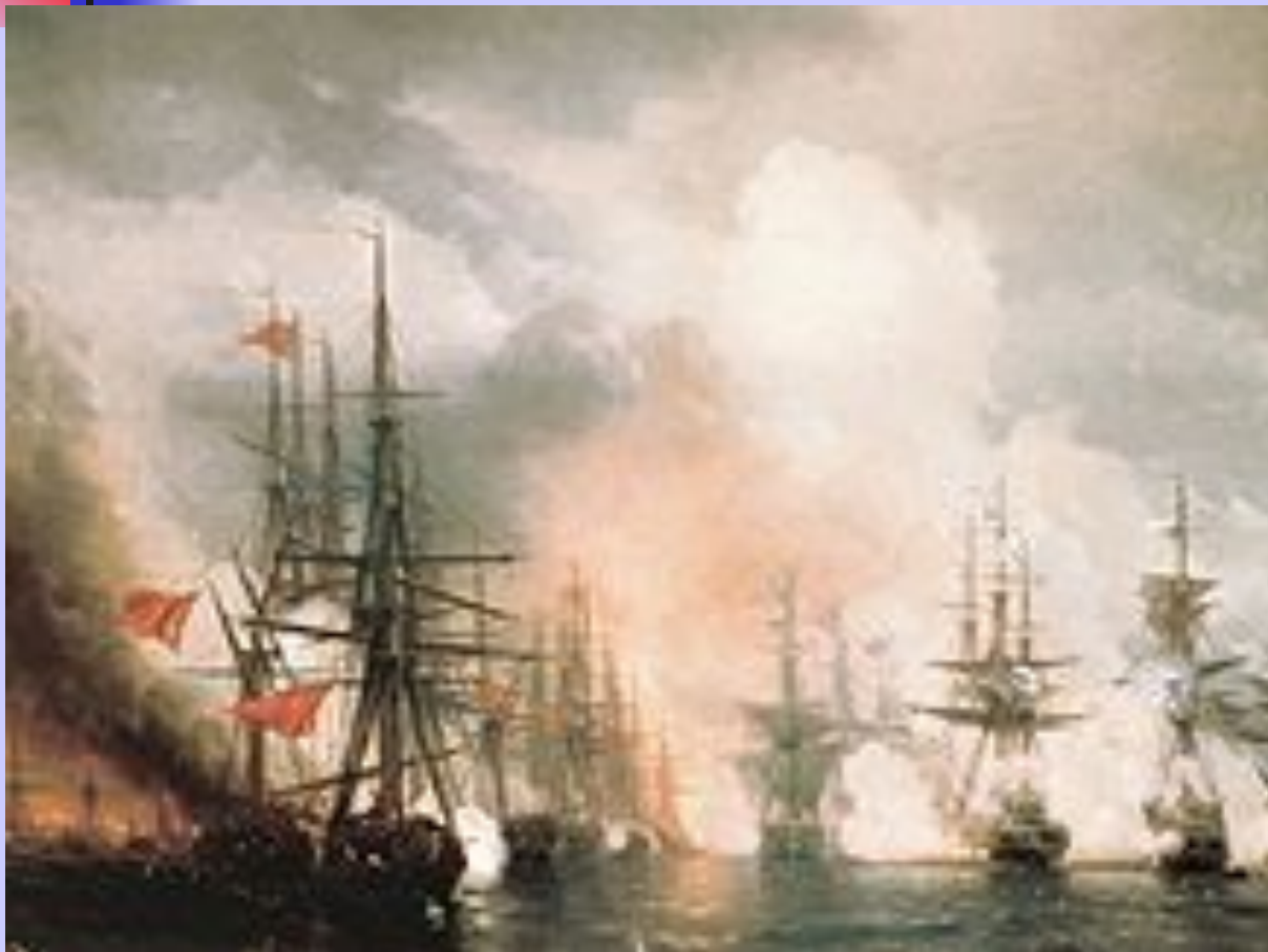
И.К. Айвазовский. Синопский бой.