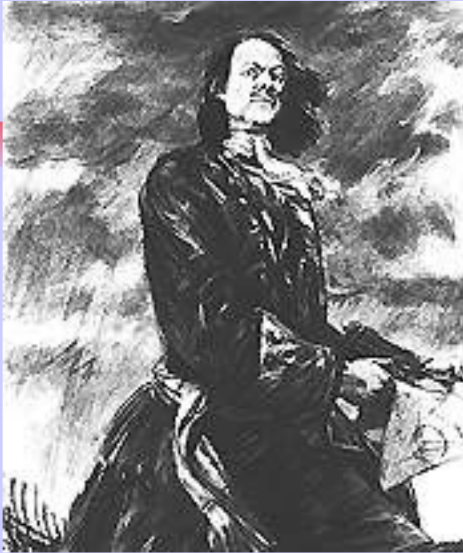
Д. А. Шмаринов.