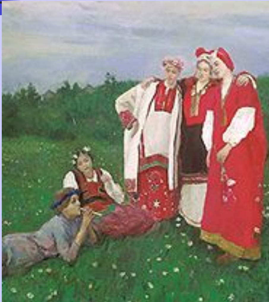
К.А. Коровин. Северная идиллия.