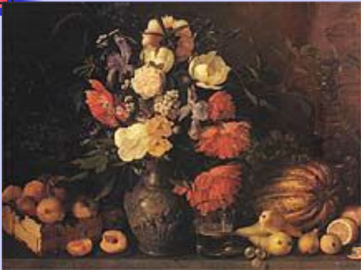
И. Т. Хруцкий. «Цветы и плоды».