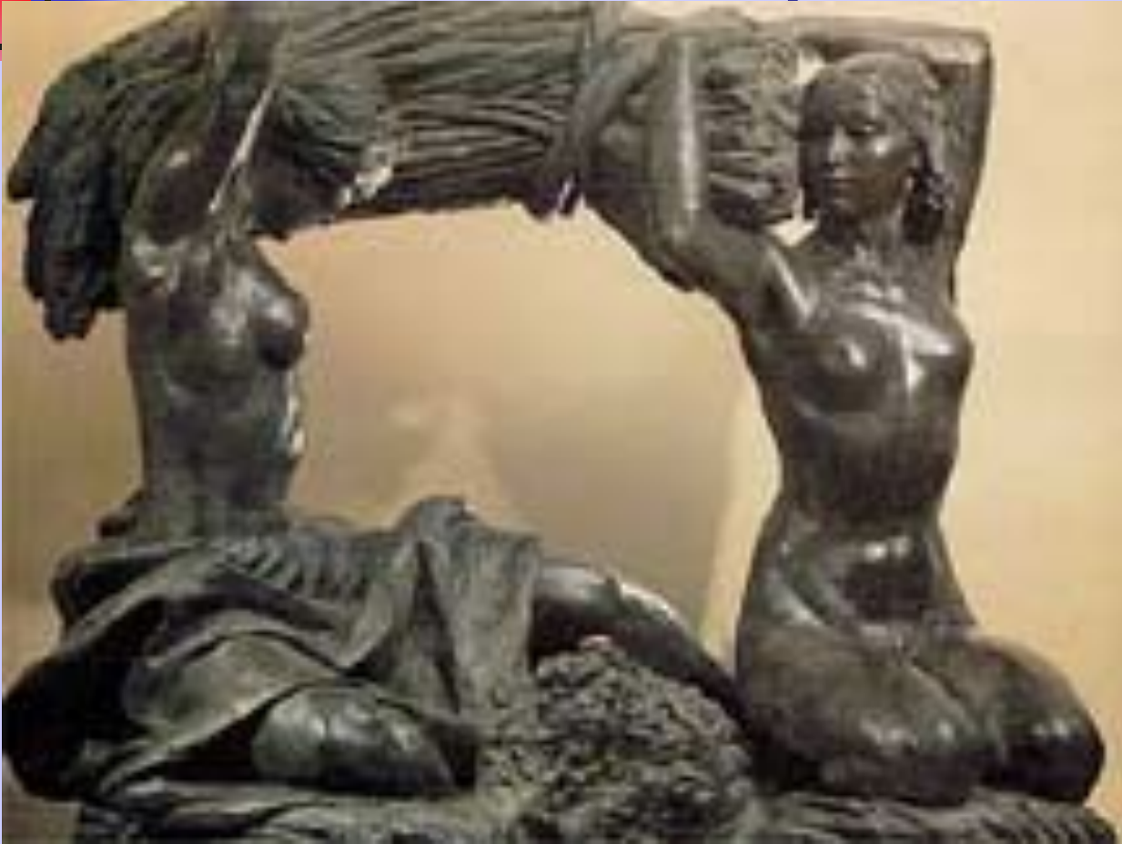
В. И. Мухина. «Хлеб». Декоративная композиция для нового Москворецкого моста в Москве.