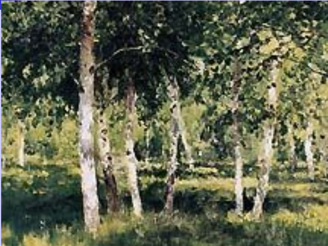
И.И. Левитан. Березовая роща.