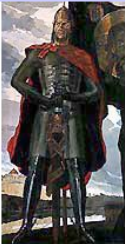
П. Д. Корин «Александр Невский»