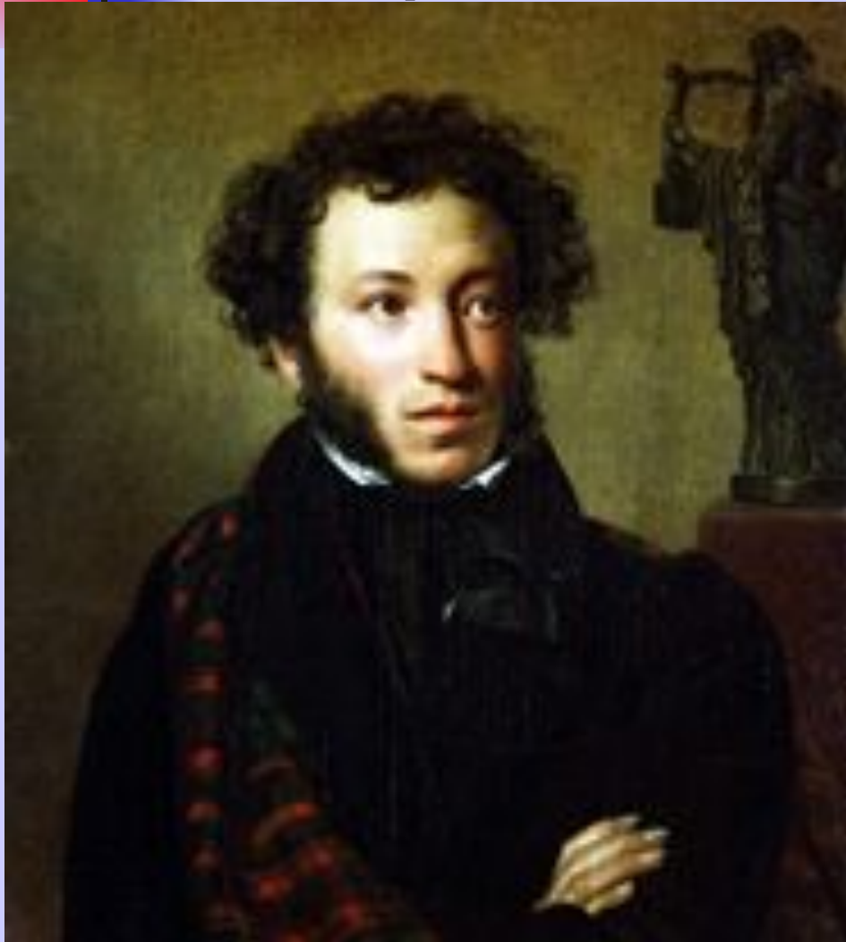
О.А. Кипренский. Портрет А.С. Пушкина.