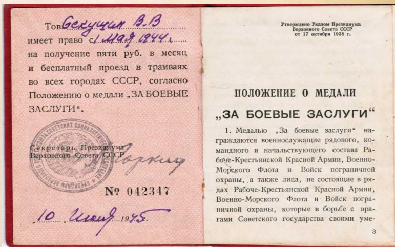
Копия удостоверения к медали «За боевые заслуги»