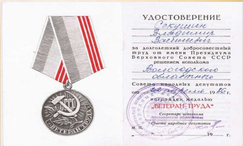
Копия удостоверения к медали «Ветеран труда»