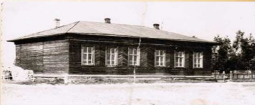
Здание начальной школы деревни Кулибарово. Фото 1968 года