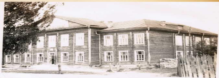
Здание семилетней Миньковской школы. Фото 1964 года