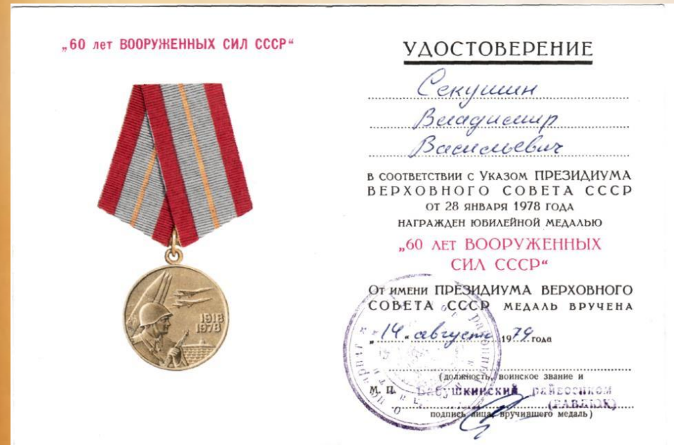
Копия удостоверения к медали «60 лет вооруженных сил СССР»