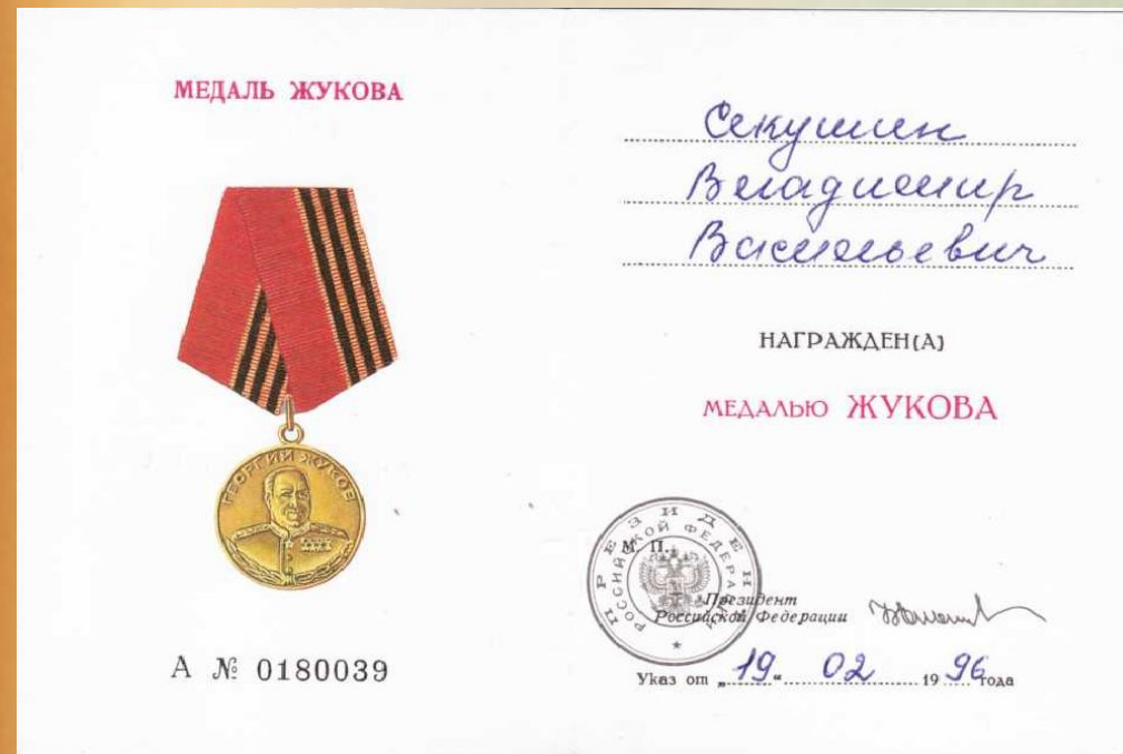
Копия удостоверения к медали Жукова

За боевые заслуги награждён орденом Отечественной войны, медалью Жукова и юбилейными медалям