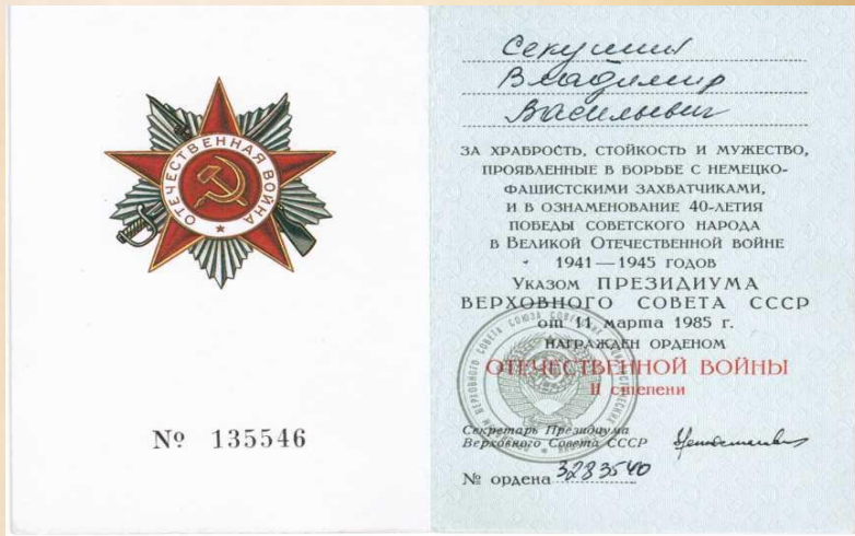
Копия удостоверения к ордену Отечественной войны второй степени