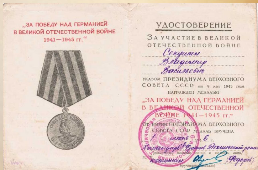
Копия удостоверения к медали «За победу над Германией в Великой Отечественной войне 1941 – 1945 гг.»

За боевые заслуги награждён орденом Отечественной войны, медалью Жукова и юбилейными медалям