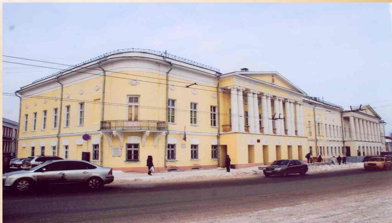
В этом здании в годы войны располагался эвакогоспиталь №1888. Город Владимир, ул. Большая Московская. Фото наших дней