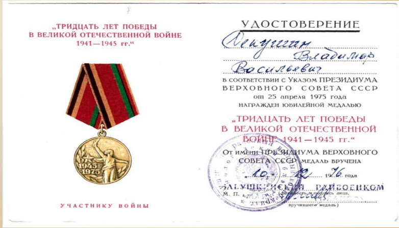
Копия удостоверения к медали «Тридцать лет Победы в Великой Отечественной войне 1941 – 1945 гг.»