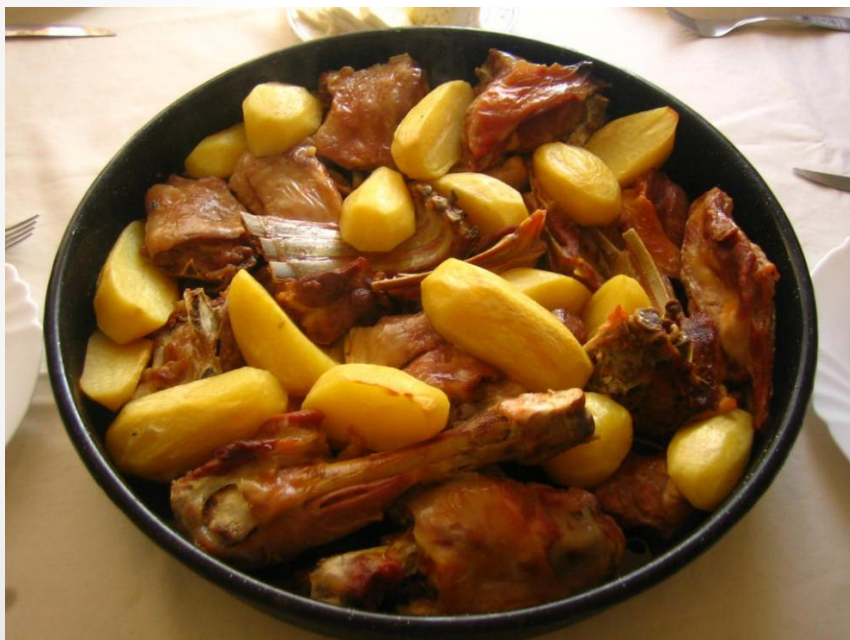
Ягнетини из-под сача