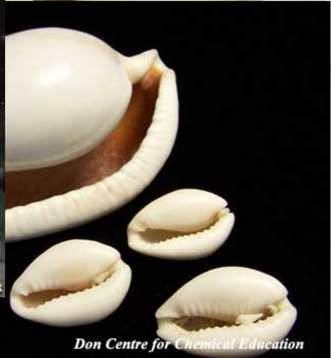
Don Centre for Chemical Education