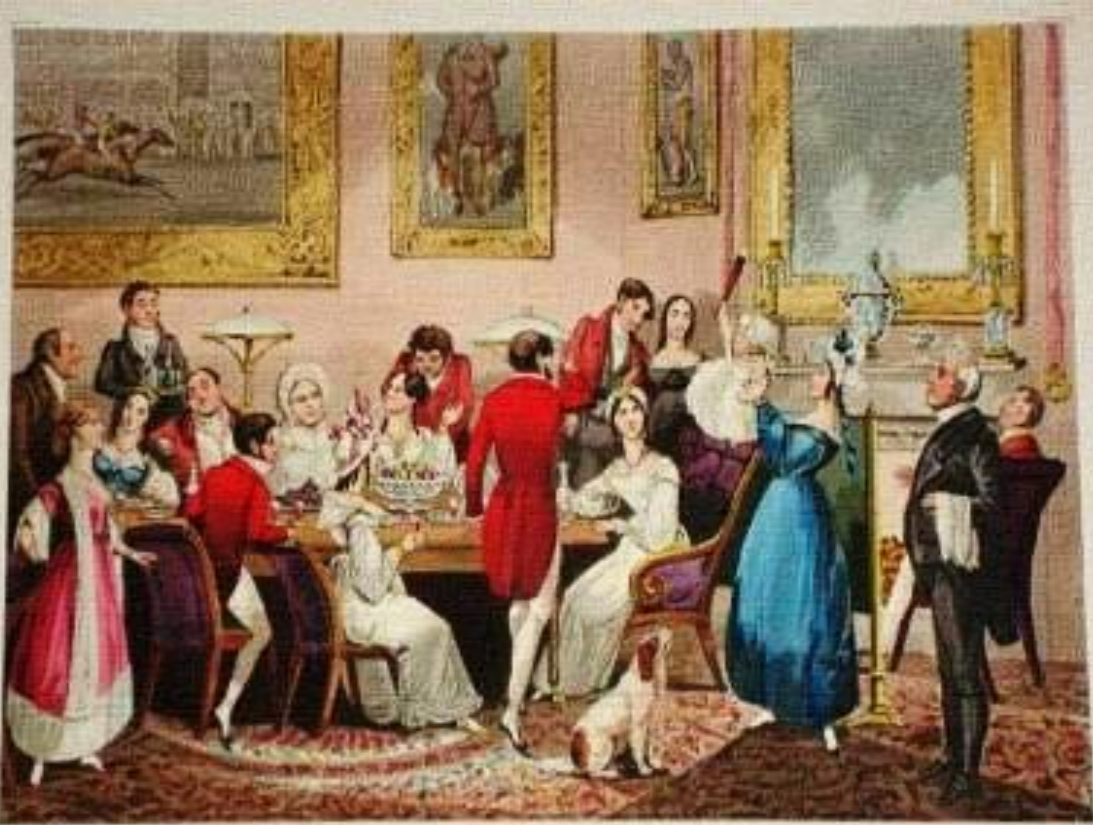
THE DEBUT: OR FIRST ATTEMPT AT THE BRUSH!

На золовкины посиделки молодая невестка приглашала своих родных к себе. Родственники собирались на чаепитие с блинами, пели песни, озорные частушки, танцевали.