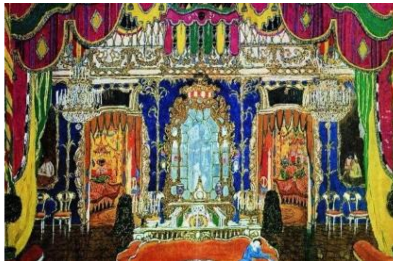
А.Я.Головин. Эскиз декорации к драме М.Ю. Лермонтова «Маскарад»