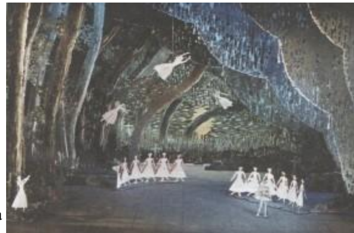
С.М.Бархин. Эскиз к декорации к балету А.Адана «Жизель»