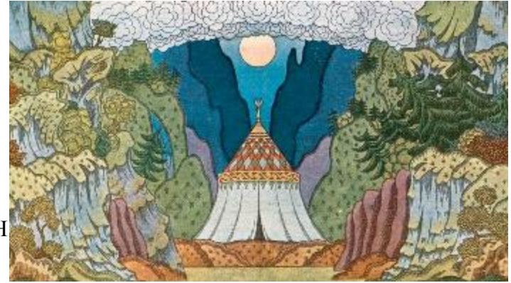
К.А. Коровин. Эскиз декорации к опере Римского - Корсакова «Золотой петушок»