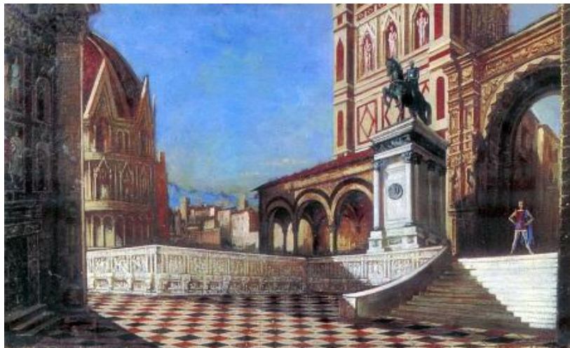
П.В. Вильямс. Эскиз декорации к балету с.с Прокофьева «Ромео и Джульетта»