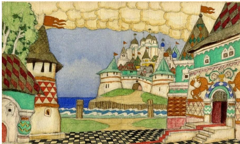
И.Я. Билибин. Декорации к опере Н.А. Римского- Корсакова «Сказка о царе Салтане»

расстоянии от зрителя. Как часть оформления сцены кулисы могут представлять собой, например, элемент архитектуры, часть городской улицы, интерьера и прочее, уточняя тем самым место развития событий в спектакле.