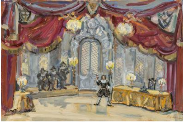
К.А. Коровин. Эскиз декорации «Дон Жуан»

Художник решает оформление всех трёх зон сцены как единого организма с учётом общего замысла режиссёра, идеи и содержания. Арьерсцена играет важную роль для создания иллюзии глубины пространства. С этой целью на задней стене арьерсцены художник создаёт специальную декорацию-задник