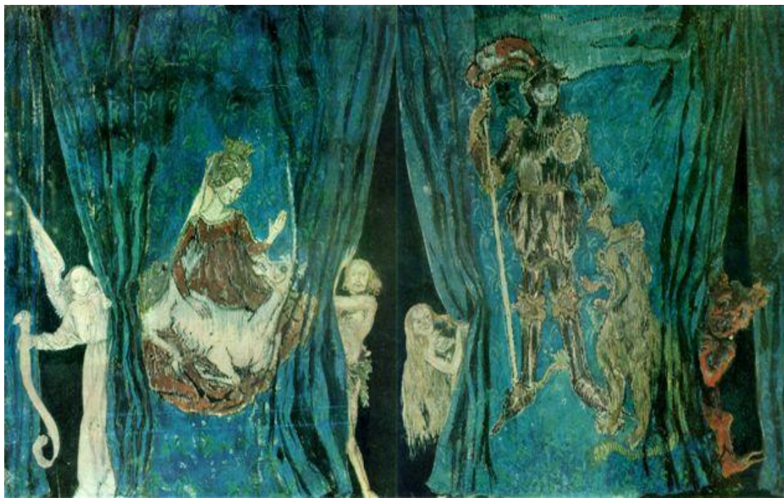
А.Н. Бенуа. Эскиз занавеса для «Старинного театра» в Петербурге

С искусством театра и кино тесно связано театрально-декоративное искусство создания зрительного образа постановки посредством