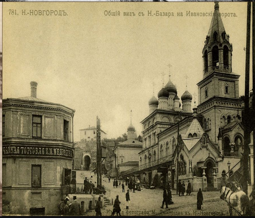
Общій видъ съ Н.-Базара на Ивановскія ворота.