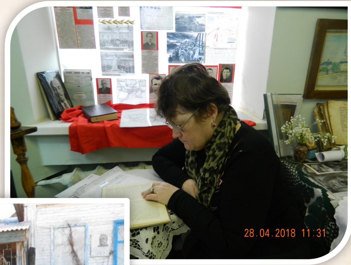
Поиск ответов на вопросы конкурса