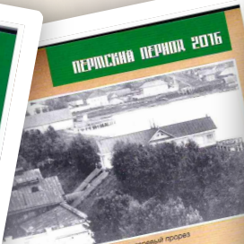
Вид завода на перемычке