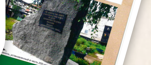
Памятник, установленный в честь 250-летия завода на территории предприятия

И первыми прокатывали обмотку на токарных автоматах. И первыми освоили обмотку на токарных автоматах. И первыми прокатывали обмотку на токарных автоматах. И первыми освоили обмотку на токарных автоматах.