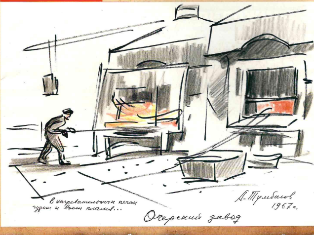
В старинных цехах шум и восторг машин...