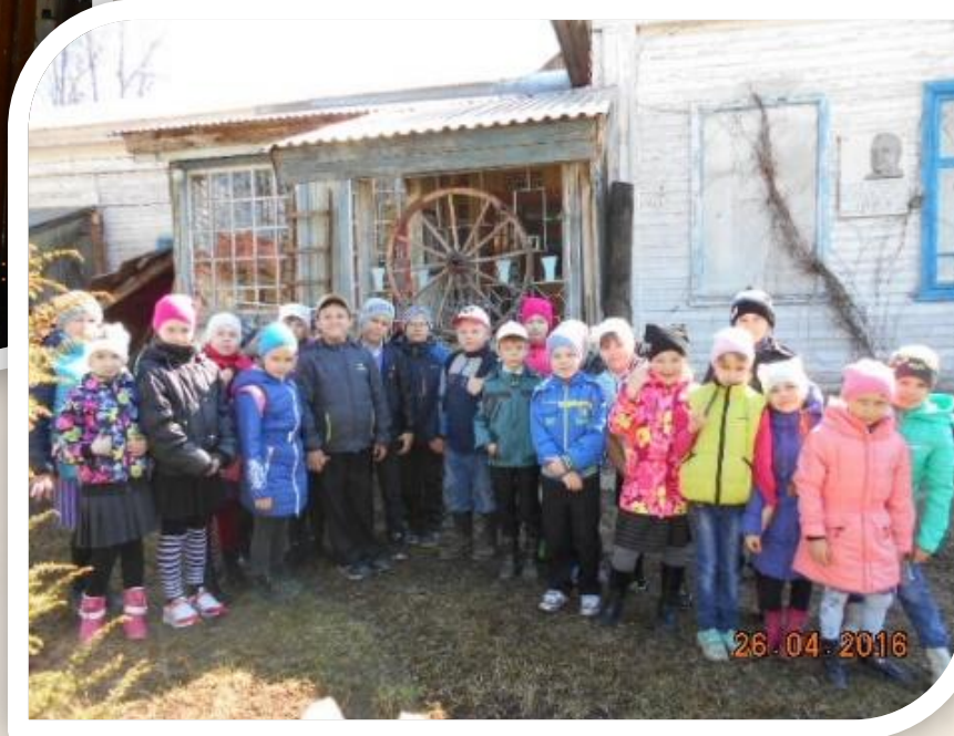
Группа д/сада после экскурсии