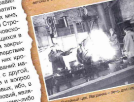
Литейный цех. Вагранка – печь для чугуна