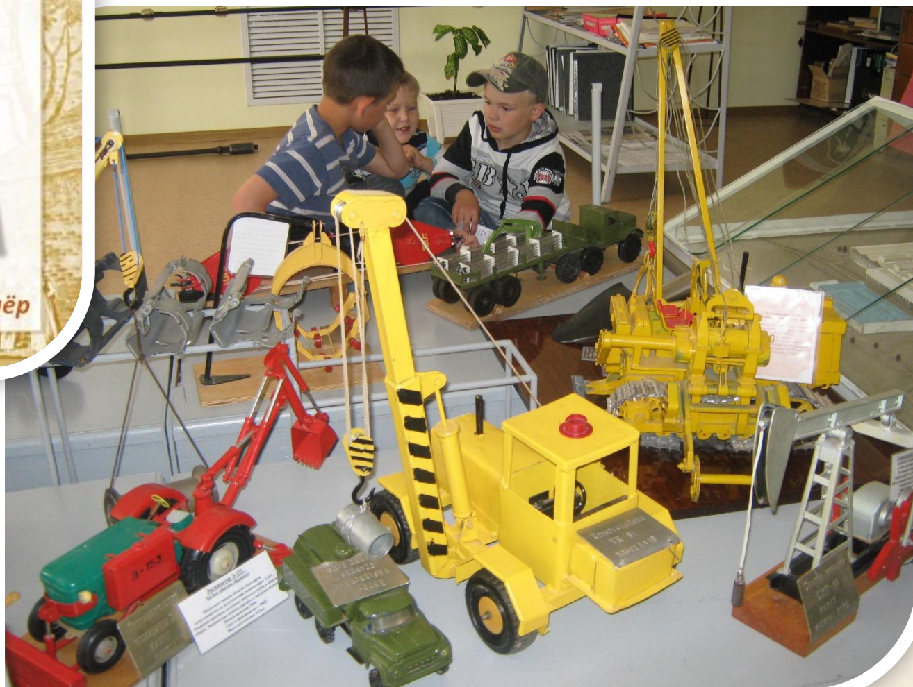
Движущиеся макеты изделий завода