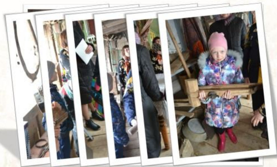
Путешествие в старый Очёр