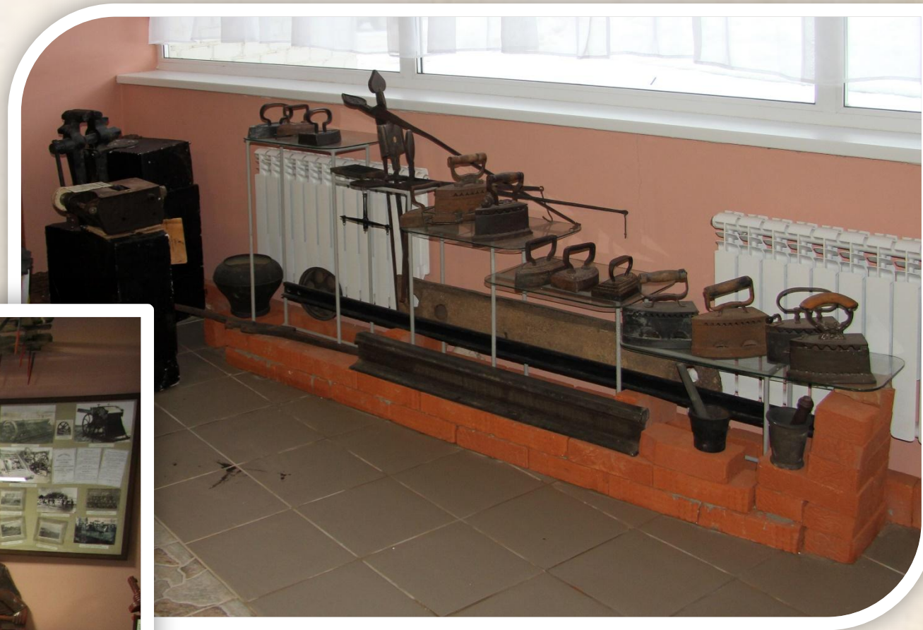
Граф А. С. Строганов в музее