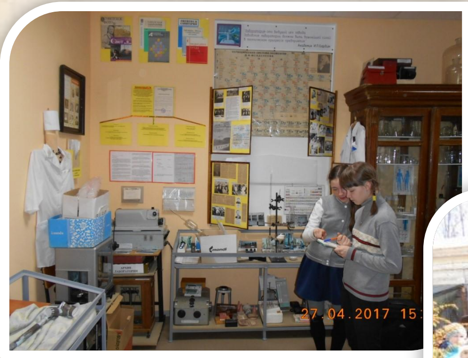
Знакомство с работой заводских лаборантов