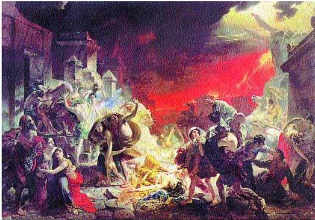
К. Брюллов, Последний день Помпеи Русский музей