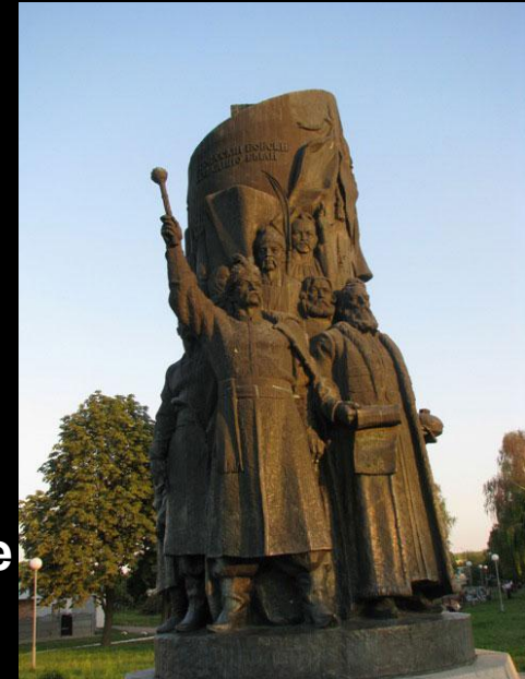
Памятник в Переяславле