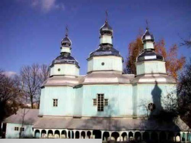
Церковь в Зборове