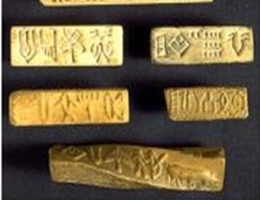
Таблички с печатями, найденные в долине Инда