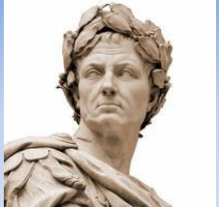
Гай Юлий Цезарь