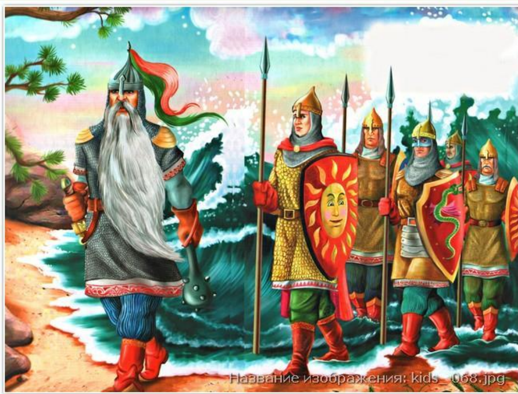
Название изображения: kids_068.jpg