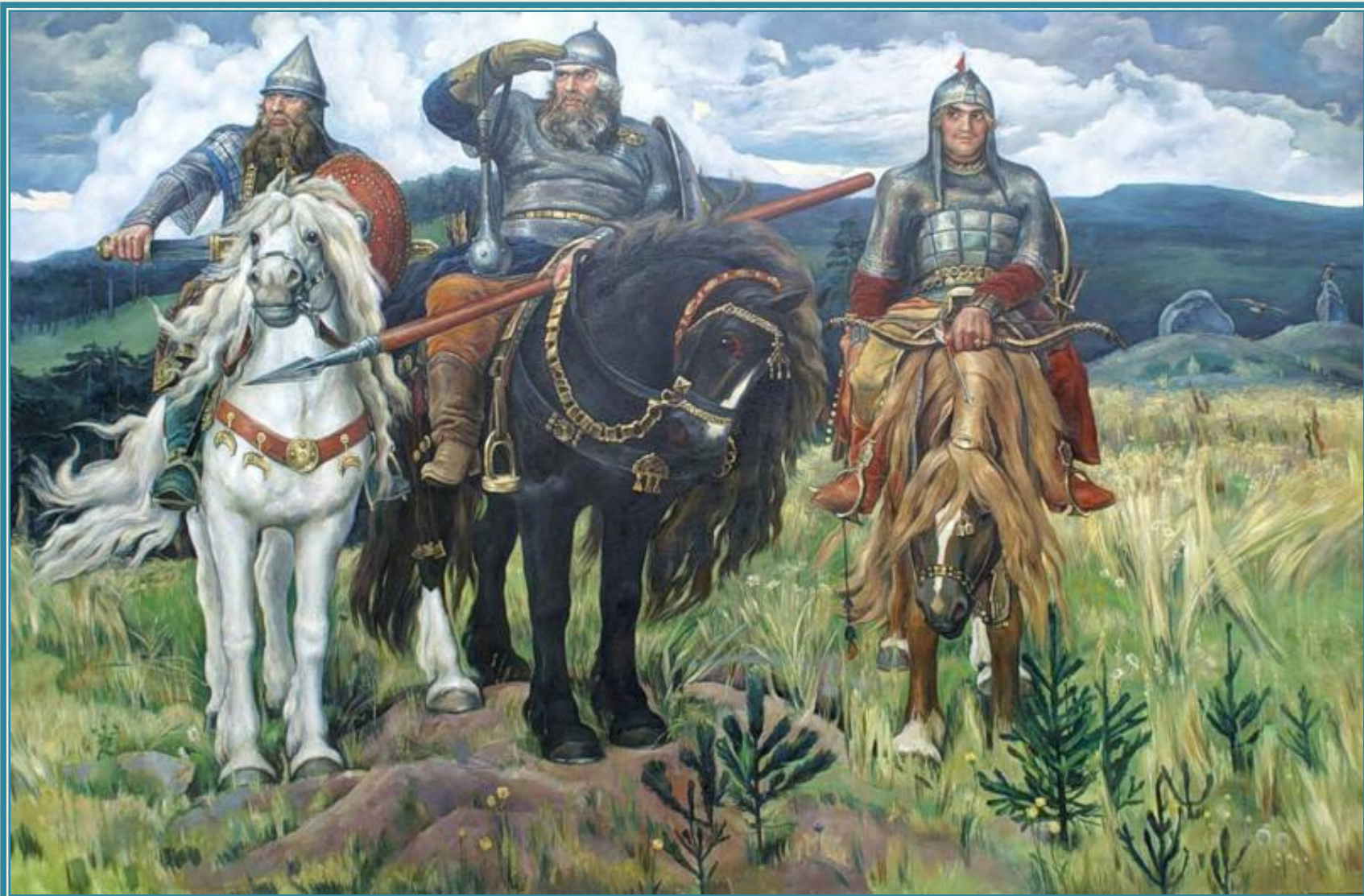
В.М. Васнецов. « Богатыри ». (1898 г.)