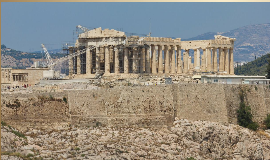
Вид на холм Акрополя, увенчанный Парфеноном

Кульτ тела и физической красоты стал одной из сторон воспитания личности. Расцвет архитектуры и размах строительства характеризуют культурный подъем Афин V в. до н.э. Образцом классического совершенства стала скульптура афинских мастеров. Лирика и греческая трагедия, как и гомеровский эпос, выполняли вместе с эстетическими и воспитательные функции. В трагедии получило наиболее полное выражение такое понятие, как катарсис, т. е. очищение, облагораживание людей, освобождение их души от негативных эмоций. Герои трагедии определяли понятие правды и справедливости, установленных богами законов. Но во всех трагедиях человек зависим от воли богов, и только в трагедиях Софокла, а впоследствии и Еврипида, он является личностью, самостоятельно определяющей свой выбор. С этого началось обращение к человеку как к свободной личности и рост индивидуализма, проявившиеся в культуре Древней Греции в конце V в.