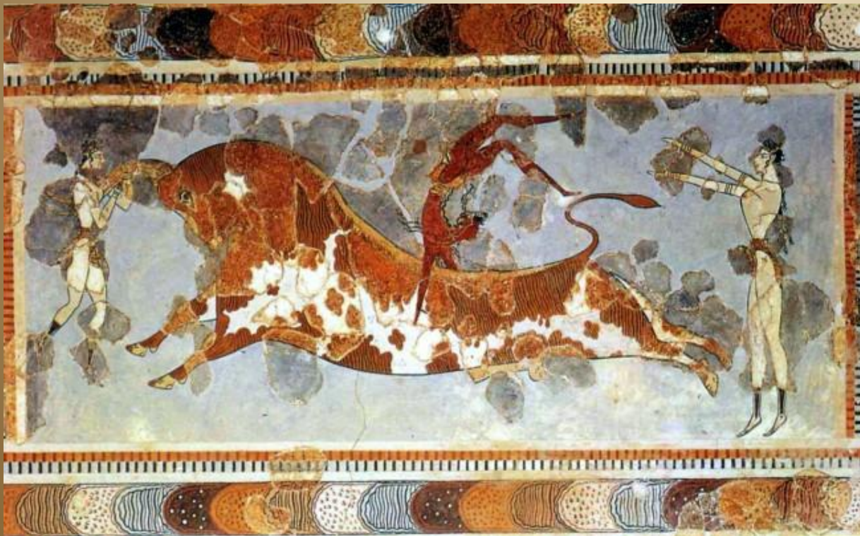
Роспись Кносского Дворца: «Игры с быками»

Искусство этого периода характеризует высокое мастерство художников и зодчих Крита. Благодаря раскопкам А. Эванса на рубеже XIX—XX веков была открыта удивительная по красоте художественная культура Крита, названная им минойской. Ансамбли дворцов, росписи стен (фрески), керамика впечатляют свободной живописностью, фантазией, высоким художественным уровнем исполнения.