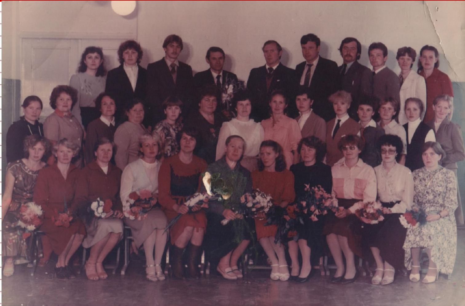
Коллектив учителей Гайнской средней школы в 80-е гг. 20 века