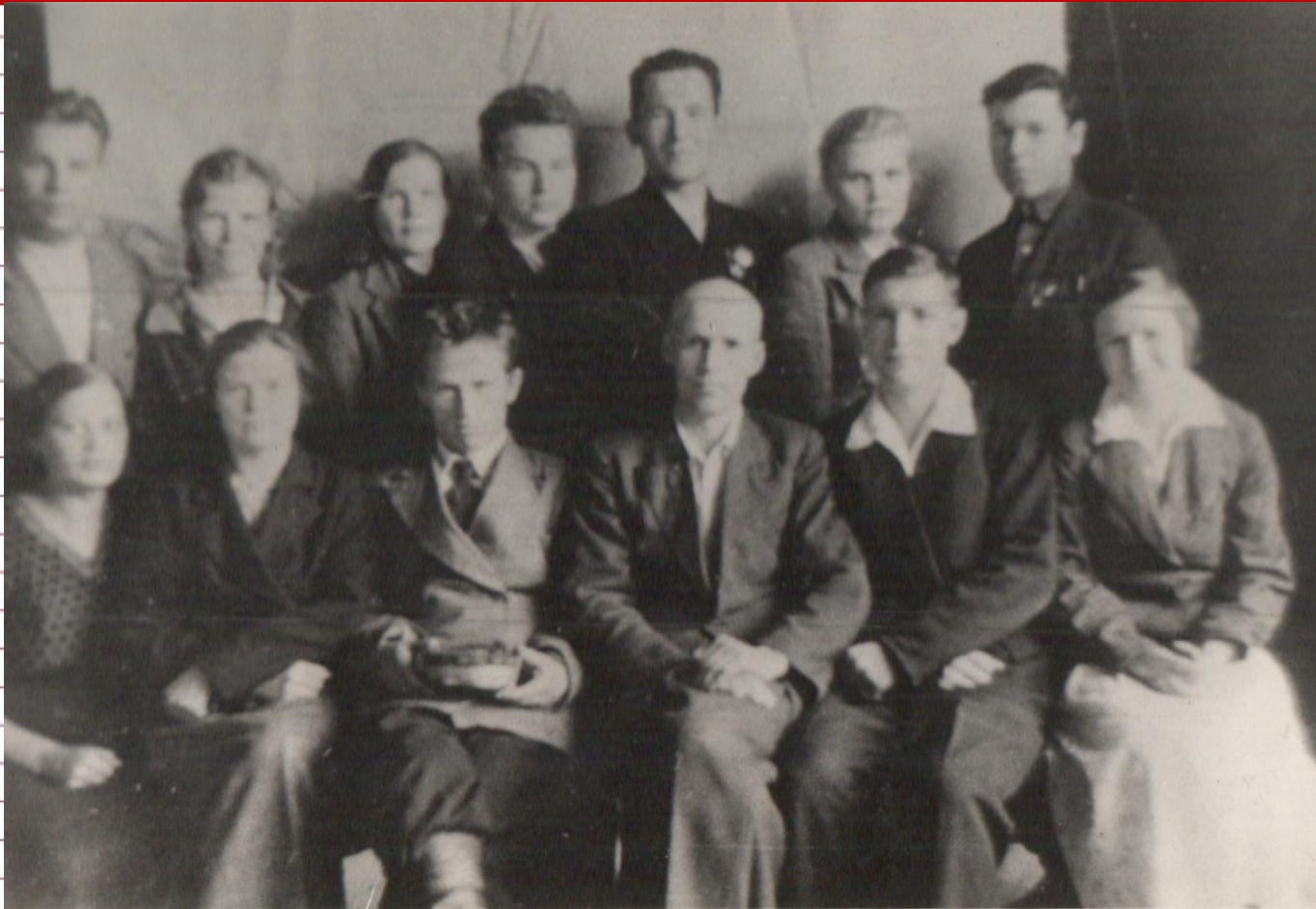
Коллектив учителей Гайнской средней школы в 40-е гг. 20 века