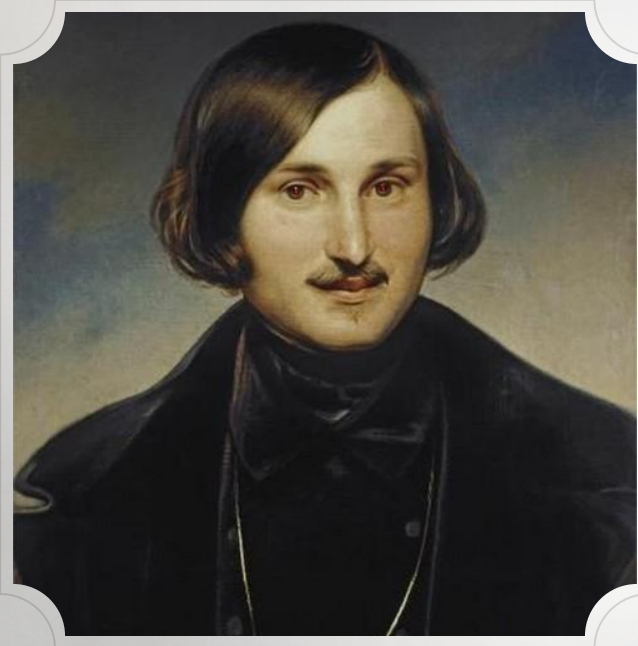
ПОРТРЕТ НИКОЛАЯ ГОГОЛЯ.