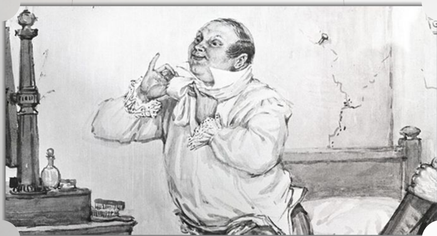
ПАВЕЛ ИВАНОВИЧ ЧИЧИКОВ В ГОСТИНИЦЕ ГУБЕРНСКОГО ГОРОДА.