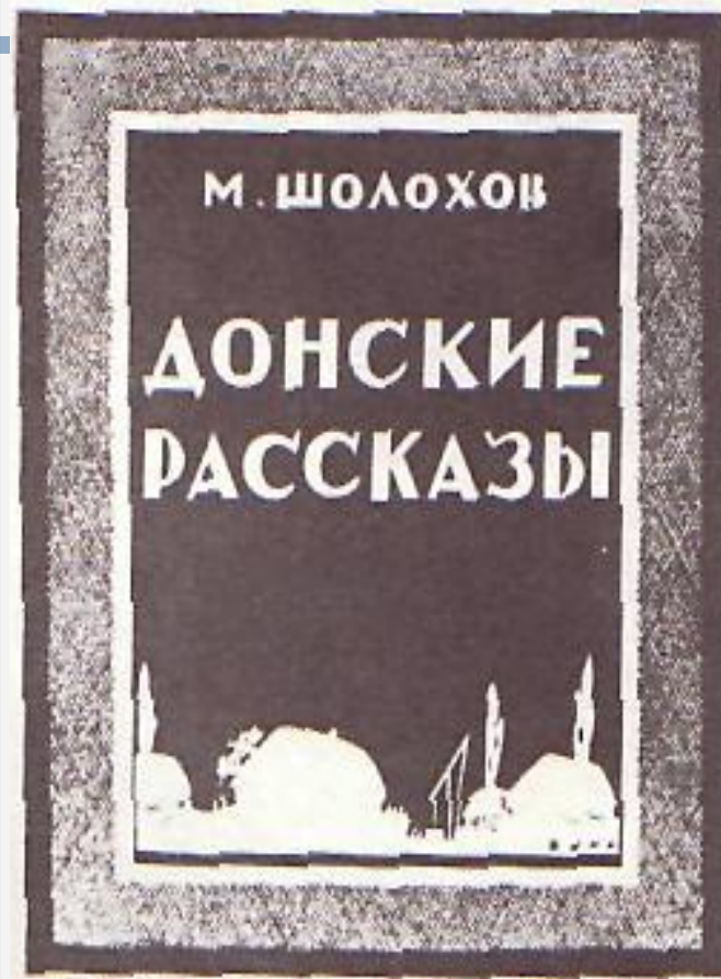
Обложка первого издания.