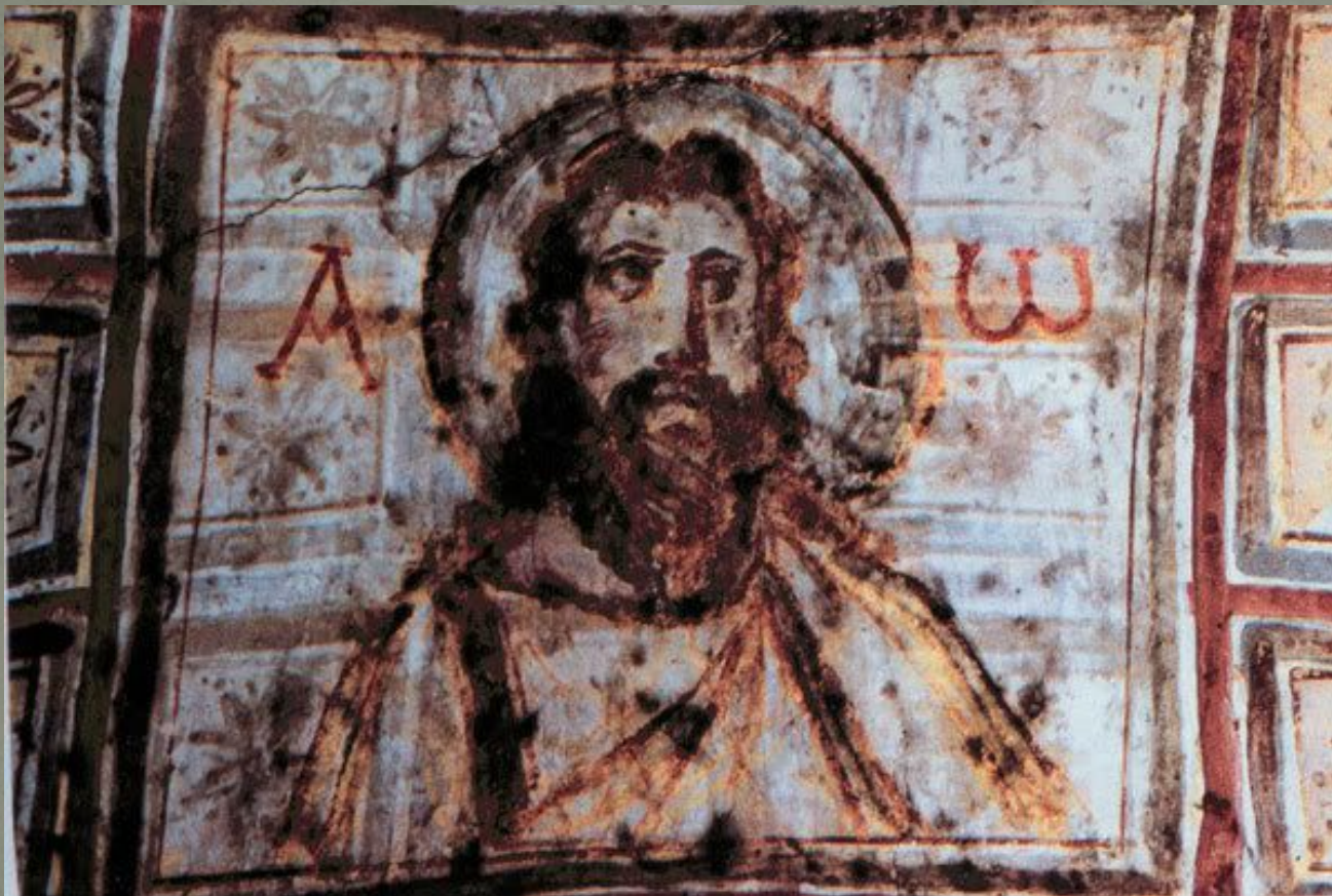
Иисус - Альфа и Омега. Катакомбы Коммодиллы. 4 в ("Аз есмь Альфа и Омега" (Откр. 1, 8)

Такие изображения отличаются от античной традиции: лик Иисуса принимает более строгий и выразительный характер. Волосы изображаются длинными, часто с пробором посреди головы, добавляется борода, иногда разделённая на две части. Появляется изображение нимба.