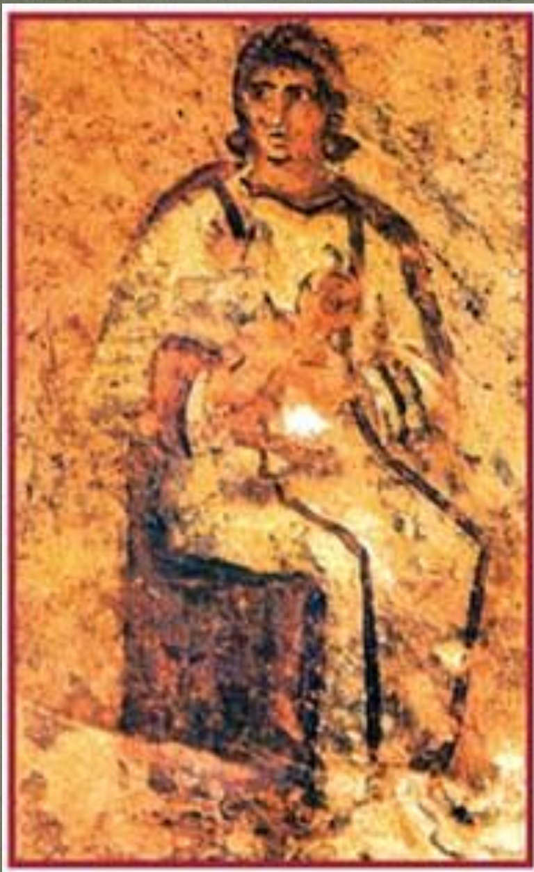
Богоматерь с младенцем. III век

В живописи появились те новые качества, которые историки искусства позднее назовут «психологизмом», «духовностью», «экспрессивностью». Этот трагизм образов, неведомый до того времени, знаменовал начало христианского искусства. Катакомбное изобразительное искусство, которое зародилось и развивалось в недрах земли, изолированное от «обычного» зрителя и «обычных» эстетических критериев оценки, заговорило новым языком — контрастным, предельно лапидарным и предельно живописным.