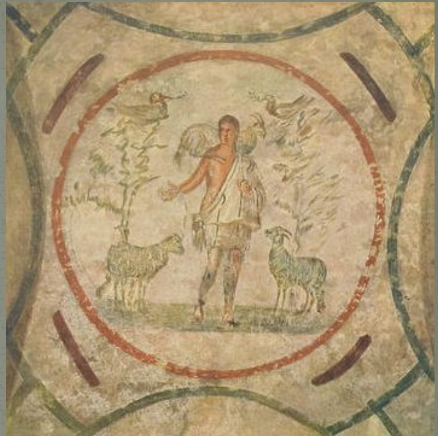
Христос - Добрый Пастырь.